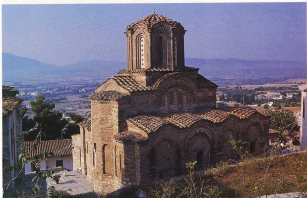
Μονή Ολυμπιώσιος Ελασσόνας: Εξωτερική άποψη του καθολικού της Μονής.