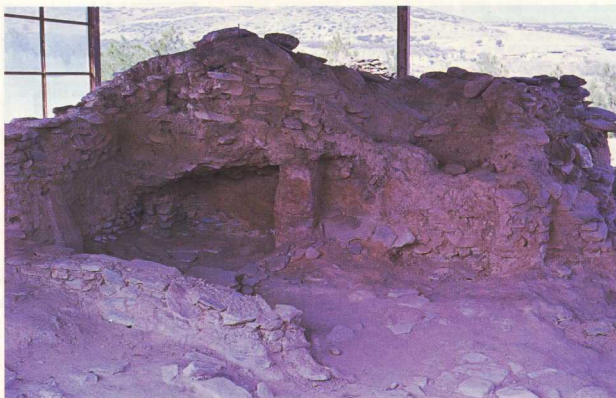
2. Νεολιθικός οικισμός Σέσκλου: Οικία κεραμέα (οικία 11-12).

τα πρώτα γραπτά αγγεία. Η ποιότητα του πηλού και το ψήσιμο των κεραμικών τελειοποιούνται αλλά τα σχήματα παραμένουν ακόμα απλά. Στην τρίτη φάση (Προσέσκλο) εμφανίζεται η γραπτή κεραμική και επικρατούν τα μονόχρωμα αγγεία, που μερικές φορές έχουν και πλαστική διακόσμηση. Τα σχήματα γίνονται πιο σύνθετα.