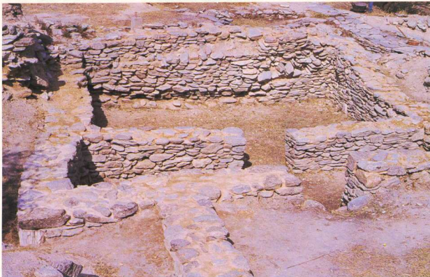
1. Νεολιθικός οικισμός Σέσκλου: Μέγαρο 7-8-9 της Μέσης Νεολιθικής πάνω στην «Ακρόπολη».

χάρης απέδειξε ότι ένας εκτεταμένος οικισμός κατελάμβανε όλη την έκταση γύρω από τον οικισμό, που ο Τσουντας είχε ονομάσει «Ακρόπολη», ήδη από τις αρχές της Αρχαιότερης Νεολιθικής.