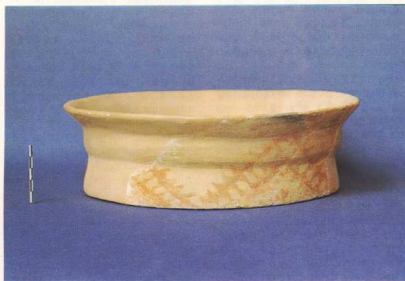
4. Νεολιθικός οικισμός Σέσκλου: Γραπτό αγγείο της Μέσης Νεολιθικής.

Σχεδόν όλα τα αρχιτεκτονικά λείψανα πάνω στην «Ακρόπολη» που είναι ορατά σήμερα