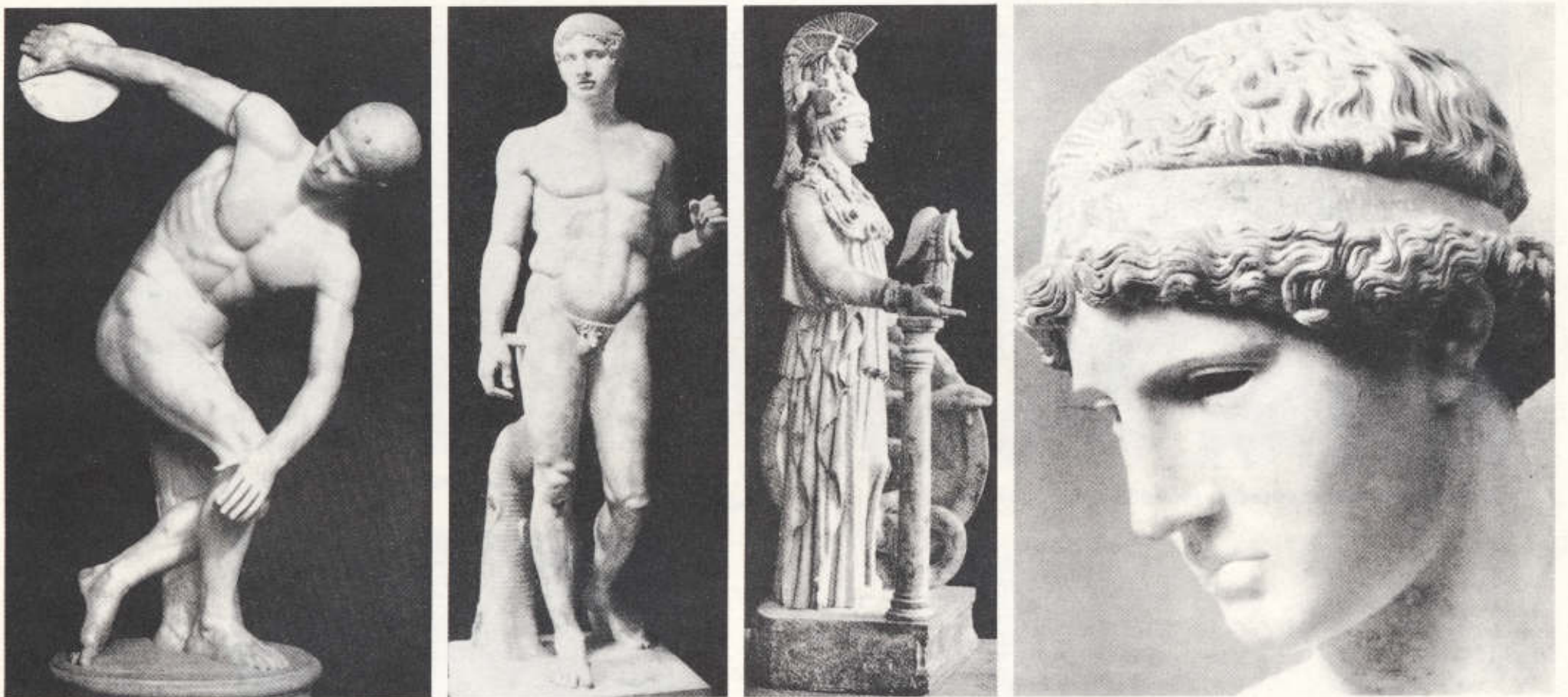
22. Ο Δισκοβόλος του Μύρωνα (460-450 π.Χ.). Ρωμαϊκό αντίγραφο. 23. Ο Δορυφόρος του Πολύκλειτου (450-440 π.Χ.). Ρωμαϊκό αντίγραφο. 24. Αθηνά Παρθένος. Ρωμαϊκό αντίγραφο σε σμίκρυνση, από το χρυσελεφάντινο άγαλμα του Φειδία που ήταν τοποθετημένο στον Παρθενώνα. 25. Κεφαλή της Αθηνάς Λημνίας του Φειδία (440 π.Χ.). Ρωμαϊκό αντίγραφο.