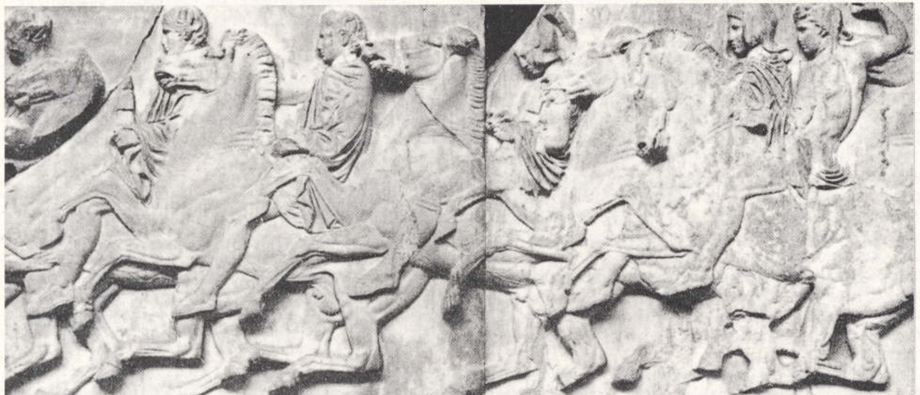
30. Ζωφόρος του Παρθενώνα (442-438 π.Χ.). Ιππείς.

Κείμενα: Σταυρούλα Δ. Ασημακοπούλου Αρχαιολόγος