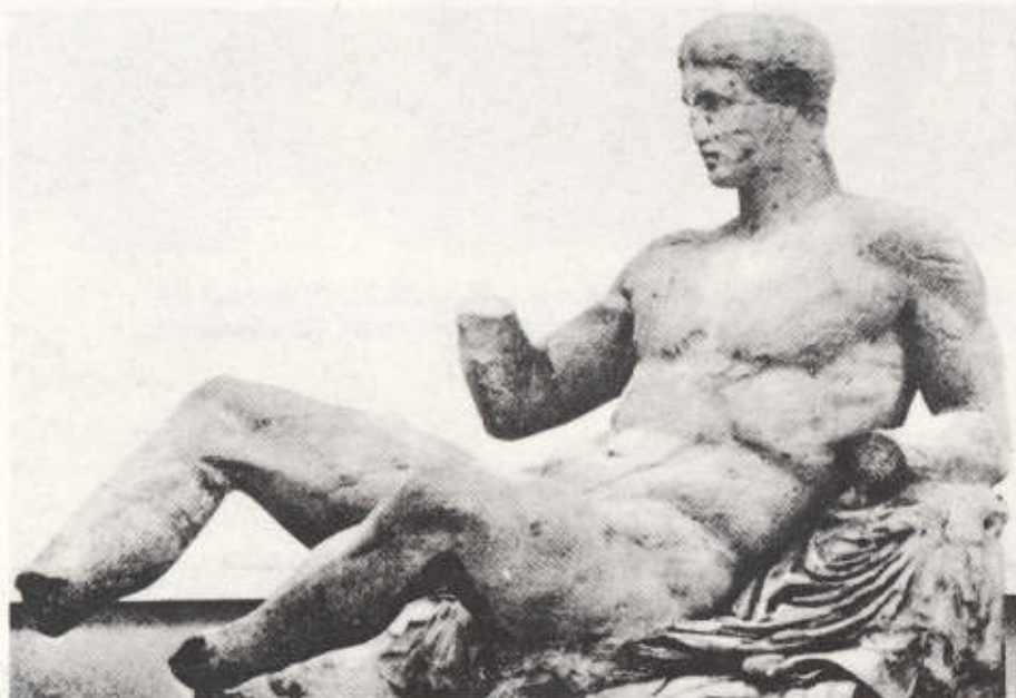
28. Θησέας, από το ανατ. αέτωμα του Παρθενώνα (438-431 π.Χ.).