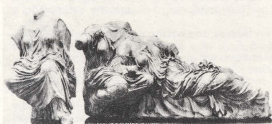
29. Οι Μοίρες, από το ανατ. αέτωμα του Παρθενώνα (438-431 π.Χ.).