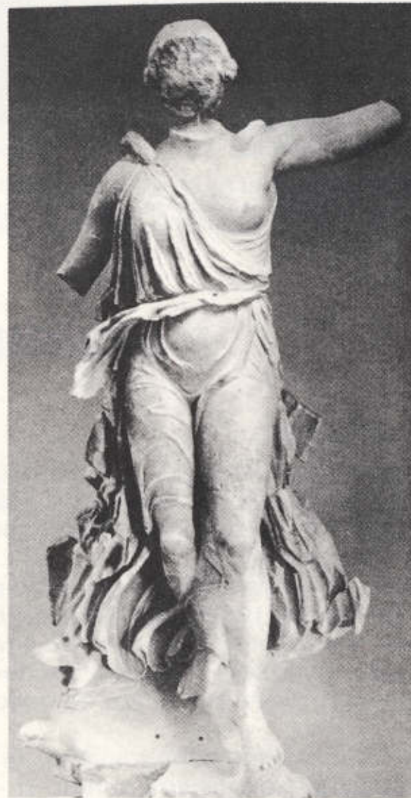
31. Η Νίκη του Παιωνίου (420 - 410 π.Χ.).