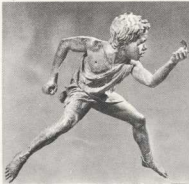
41. Νεαρός ἰππέας (τζόκει), 240 - 200 π.Χ. (Εθνικὸν Αρχ. Μουσείο).