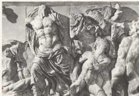
46. Λεπταμέρεια από τη ζωφόρο του Βωμώ της Περγάμου.