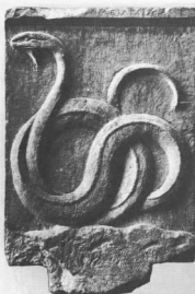
Αναθηματικό ανάγλυφο από το ιερό του Διός Μελιχίου (4ος αι. π.Χ.) (Μουσείο Βερολίνου).

τρεία της Βενδίδος, για την οποία έχουμε και τις περισσότερες πληροφορίες: διακρίνονται πράγματι χωριστές λατρείες, πιθανόν και ιερά των επιχωρίων και των Θρακών, που βρίσκονται αντίστοιχα κοντά στο ιερό της Μουνιχίας και στην περιοχή της Φρεατύδος. Εντυπωσιακή ήταν και η λαμπρότητα της εορτής. Εκτός από την πομπή που γνωρίζουμε από την αρχή της Πολιτείας του Πλάτωνα, αναφέρεται μεγάλη θυσία (πιθανόν εκατόμβη), έπιππη λαμπαδηφορία και παννυχίς. Πολύ καλά πληροφορημένοι είμαστε επίσης για τη λατρεία της Μητέρας των Θεών. Αντίθετα με τον επίσημο χαρακτήρα της Βενδίδος, η πειραϊκή λατρεία των οργεώνων ή θιασωτών της Μητέρας των Θεών (όπου συμμετέχουν και Αθηναίοι πολίτες) διακρίνεται σαφώς από την επίσημη αθηναϊκή στο Μητρώον, πλυσίον του Πρυτανείου: η θεά διατηρεί εδώ τη θαρσαρική της μορφή και πιθανόν συνοδεύεται από τον Άττι, όπως δείχνει η οργάνωση Αττιδεών. Η ακμή του ιερού συνδέεται με την πολιτική των Ατταλιδών στο 220 π.Χ. κ.ε. Από πλήθος επιγραφών πληροφορούμαστε για τις πολλαπλές δραστηριότητες του ιερού, εκμετάλλευση των υδάτων που έχει το ιερό στη διάθεσή του, εράνους