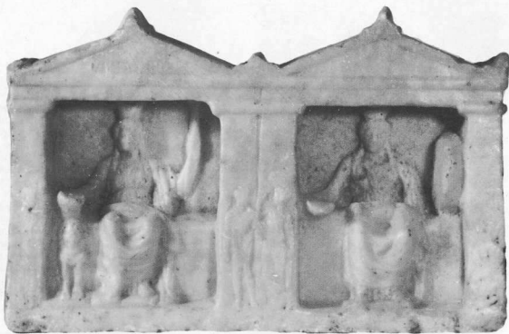
Διπλός ναϊσός Μητέρας των Θεών από το Μητρώον του Πειραιώς, ελληνησττικής εποχής. Μουσείο Πειραιώς.