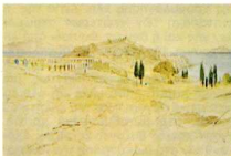
6. Υάτογραφία του Edward Lear, Καθόλο.

Φλωρεντία τό 1496 ή και θιβλία πού προέρονται από τό πρώτο καθαρά έλληνικό τυπογραφείο του Νικ. Βλαστού στή Βενετία (εικ. 3).