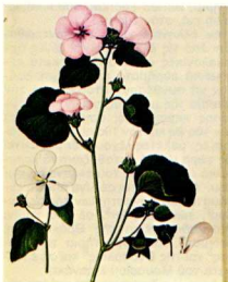
5. Αγριολούουδα από την Κέρκυρα. Ζωγράφος άγνωστός από τον Scola για τον Frederic North.