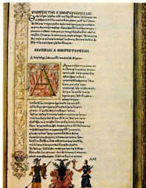
3. Πρώτη έκδοση του Όμηρου. Φλωρεντία 1488.