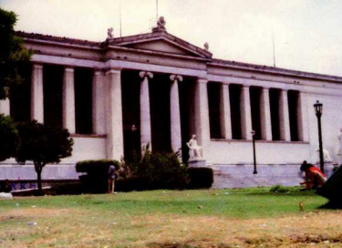
1. Κεντρικό κτίριο του Πανεπιστημίου.