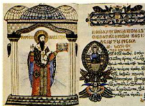
4. Χειρόγραφο του 1660 (1)