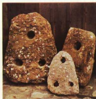
Πέτρινες άγκυρες της μυκηναϊκής εποχής από το θόρειο λιμάνι της Μεσημβρίας.

Όλοι οι μύθοι που συνδέθηκαν με τη Μαύρη Θάλασσα, οι άθλοι, τα τέρατα, τα διφυή όντα όπως οι Αμαζόνες και η γυναίκα-φίδι, οι κυνηγοί κεφαλών Ταύροι και που θυσιάζαν ναυαγούς, αλλά και οι μάγισσες Μήδεια και Κίρκη, όλες οι φανταστικές ιστορίες χωρούν μέσα στις υπερβατικές δυνατότητες της αρχαίας ελληνικής σκέψης.