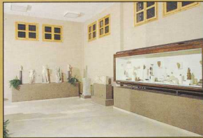
Τα ευρήματα του Ιερού της Δήμητρας.

γενναϊώδης χρηματοδότηση από το Ίδρυμα Γ. Α. Λεβέντη στον ειδικά διαμορφωμένο ημιυπόγειο χώρο του Μουσείου. Αρχιτεκτονικά μέλη και ταφικοί θώκοι μαζί με μερικά άλλα μαρμάρινα έργα εκτίθενται στην τριμερή στοά και στη δεξτροφυτεμένη αυλή. Διαφορετικά κτίσματα που έγιναν με φροντίδα του Πανεπιστημίου Θεσσαλονίκης στεγάζουν την ομάδα ανασκαφής που επεξεργάζεται, καταγράφει και μελετά τα ευρήματα. Ο επισκέπτης στην είσοδο προς τη μεγάλη αίθουσα του ισογείου έχει μια πρώτη γενική εικόνα των ευρημάτων, κατά πλειοψηφία γλυπτών. Η πρώτη ομάδα γύρω από το κυκλικό περιφραντήριο (αρ. 3) αποτελείται κυρίως από τα αγάλματα που περιέχει ένας λατρευτικός χώρος των μεγάλων δημοσίων λουτρών (αρ. 4-7). Πρόκειται για το πληρύτερο σύνολο αγαλμάτων που εικονίζει τους Ασκληπιάδες: τον Μαχάονα, την Υγεία, την Αίγλη, την Πανάκεια, την Ακεούα και τον Ποδάλειο. Η επόμενη μεγάλη ενότητα περιλαμβάνει λατρευτικά αγάλματα, αναθήματα και τιμητικούς ανδριάντες από το Τέμενος της Ίσδας (αρ. 8-22).