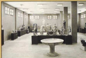
Η πρώτη μεγάλη αίθουσα με ευρήματα των Θερμών και του Ιερού της Ίσδας.