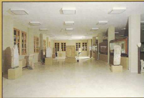
Ευρήματα από την Πύδνα και άλλους τόπους της Περίας.

γενναϊώδης χρηματοδότηση από το Ίδρυμα Γ. Α. Λεβέντη στον ειδικά διαμορφωμένο ημιυπόγειο χώρο του Μουσείου. Αρχιτεκτονικά μέλη και ταφικοί θώκοι μαζί με μερικά άλλα μαρμάρινα έργα εκτίθενται στην τριμερή στοά και στη δεξτροφυτεμένη αυλή. Διαφορετικά κτίσματα που έγιναν με φροντίδα του Πανεπιστημίου Θεσσαλονίκης στεγάζουν την ομάδα ανασκαφής που επεξεργάζεται, καταγράφει και μελετά τα ευρήματα. Ο επισκέπτης στην είσοδο προς τη μεγάλη αίθουσα του ισογείου έχει μια πρώτη γενική εικόνα των ευρημάτων, κατά πλειοψηφία γλυπτών. Η πρώτη ομάδα γύρω από το κυκλικό περιφραντήριο (αρ. 3) αποτελείται κυρίως από τα αγάλματα που περιέχει ένας λατρευτικός χώρος των μεγάλων δημοσίων λουτρών (αρ. 4-7). Πρόκειται για το πληρύτερο σύνολο αγαλμάτων που εικονίζει τους Ασκληπιάδες: τον Μαχάονα, την Υγεία, την Αίγλη, την Πανάκεια, την Ακεούα και τον Ποδάλειο. Η επόμενη μεγάλη ενότητα περιλαμβάνει λατρευτικά αγάλματα, αναθήματα και τιμητικούς ανδριάντες από το Τέμενος της Ίσδας (αρ. 8-22).