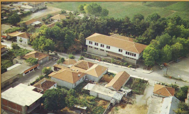
Αεροφωτογραφία του μουσείου.