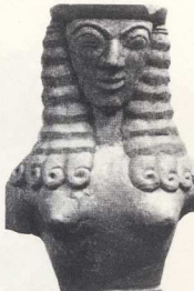
9. Ολόγλυφη γυναικεία μορφή «δαιδαλικού» τύπου του 7ου αι. π.Χ. (Μουσείο Ηρακλείου).