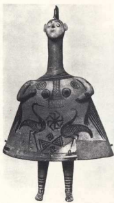
8. Βοιωτικό ειδώλιο του 8ου αι. π.Χ. (Βοστώνη, Museum of Fine Arts).