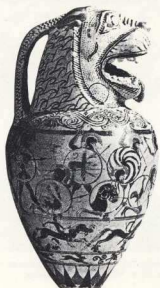
14. Αρύβαλλος σε σχήμα λέοντος. Είναι άλλος ένας τύπος πήλινων «γλυπτών».