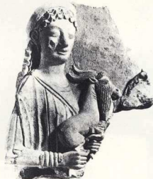
15. Από τη Γέλα (Ιταλία) προέρχεται το ανάγλυφο αυτό του 5ου αι. π.Χ., που εικονίζει τη θεά Αφροδίτη.