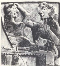
10. Θρηνώους. Πήλινο ανάγλυφο από αττικό τάφο του 630-600 π.Χ. (N.Y., Metropolitan Museum).