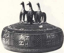
6. Ίπποι και πτηνά χρησιμεύουν ως λαβές σε πυξίδες της γεωμετρικής εποχής (Μουσείο Κεραμικής).