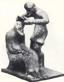
13. Βοιωτικό σύμπλεγμα «κουρέα» του τέλους του 6ου αι. π.Χ.