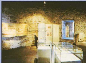
2. Έκθεση Λευκού Πύργου. ΘΕΣΣΑΛΟΝΙΚΗ. Ιστορία και Τέχνη. 2ος όροφος.