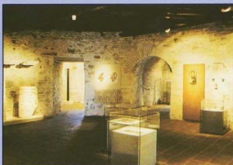
3. Έκθεση Λευκού Πύργου. ΘΕΣΣΑΛΟΝΙΚΗ. Ιστορία και Τέχνη. 3ος όροφος.