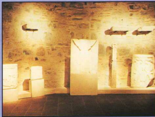
5. Λευκός Πύργος, Έκθεση συλλογής Οικονομοπούλου.

II. Η Έκθεση έχει θέμα την ιστορία και τέχνη της Θεσσαλονίκης κατά την περίοδο 300-1430 μ.Χ., δηλαδή από το συμβατικό χρονικό όριο της διείσδυσης της χριστιανικής θρησκείας στην αρχαία πόλη ως την τελική άλωση της από τους Τούρκους.