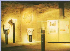
1. Έκθεση Λευκού Πύργου. ΘΕΣΣΑΛΟΝΙΚΗ. Ιστορία και Τέχνη. 1ος όροφος.