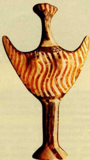
2. Μυκηναϊκό πήλινο ειδώλιο με ζωγραφισμένα τό πρόσωπο και τὰ ρούχα.