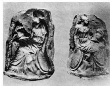
Μήτρα και ανάγλυφο από τή Σμύρνη.

Γιά να κατασκευαστεί ένα ειδώλιο σέ μητέρα πρέπει πρώτα να φιλοτεχνηθεί ένα «άρχέτυπο», στό χέρι, πάνω στό όποιο χαράζονται και πλάθονται όλες οι λεπτομέρειες. Κατόπιν, από τό «άρχέτυπο» αυτό φτιάχνονται οι πρώτες μητρες (άρνητικές) μέ τις όποιες κατασκευάζονται, μέ βιομηχανικό ρυθμό, τά ειδώλια. ‘Όταν ένας τύπος ειδωλίου έχει έπιτυχία, είναι δυνατό να θγούν μητρες άπ’ αυτό. Βέβαια οι μητρες αυτές δίνουν κάπως πιό χοντροκομμένα ειδώλια από τό άρχικό (και ελάχιστα μικρότερα), γιατί δέν άποτυπώνονται όλες οι λεπτομέρειες. Πολλές μητρες έχουν βρεθεί σέ έργαστήριο κοροπλαστικής στόν Κεραμικό και τήν ‘Αγορά τής ‘Αθήνας, στόν ‘Ολυμπο, τήν Κόρινθο, τήν Κριμαία, τή Μ. ‘Ασία, τήν Κάτω ‘Ιταλία.