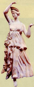
5. Δύο γυναικεία ειδώλια τῆς ἑλληνιστικῆς ἐποχῆς φτιαγμένα με μήτρα ἀπὸ τὴν Τανάγρα.