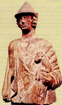
4. Εἰδώλιο Ἑρμῆ κριοφόρου κλασικῆς ἐποχῆς φτιαγμένο με μήτρα. Τὸ πρόσωπο και τὰ ρούχα εἶναι χρωματισμένα.