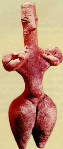
1. Νεολιθικό πήλινο γυναικείο ειδώλιο.