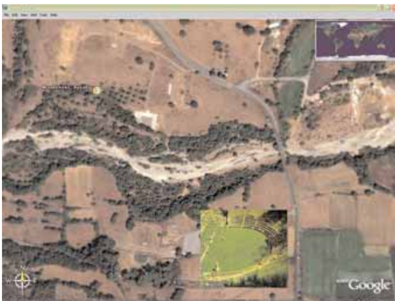
1. Ο αρχαιολογικός χώρος της Μεγαλόπολης στο Google Earth. Η φωτογραφία του αρχαίου θεάτρου της Μεγαλόπολης, που χρησιμοποιήθηκε για τη δοκιμή της εισαγωγής εικόνων, προέρχεται από τον δικτυακό τόπο του ΥΠΠΟ ( http://www.culture.gr/2/21/211/21105a/00/medium/mk05a042.jpg ).

τουργίες αναζήτησης σε ελεύθερο κείμενο. Οι περισσότεροι το έχουμε χρησιμοποιήσει τουλάχιστον για να δούμε από ψηλά την περιοχή όπου μένουμε ή την αγαπημένη μας παραλία. Αυτόματα, γράφοντας μια διεύθυνση (π.χ. πόλη, χώρα) ή ζουμάροντας στην τρισδιάστατη εικόνα της γης, μπορεί κανείς να πετάξει και να προσγειωθεί σε κάθε γωνιά του πλανήτη (bird's-eye view). Οι περισσότερες δορυφορικές εικόνες έχουν ληφθεί τρία χρόνια πριν, ενώ για ορισμένες χώρες, όπως οι Ηνωμένες Πολιτείες, διατίθενται σε πολύ υψηλή ανάλυση. Ο ηλεκτρονικός τύπος προβάλλει ανελλιπώς τις εφαρμογές του νέου αυτού εργαλείου, από τις οποίες δεν λείπουν οι αρχαιολογικές ανακαλύψεις, όπως ο εντοπισμός μιας ρωμαϊκής αγροικίας στα περίχωρα της Πάρμας στην Ιταλία από έναν χρήστη του προγράμματος, που πληροφόρησε αμέσως την ιταλική αρχαιολογική υπηρεσία για το εύρημά του ( http://www.computerworld.ch/index.cfm?pid=170&pk=30778&or=nsi , 20.9.2006). Εκτός όμως από την ερασιτεχνική χρήση, το Google Earth υπόσχεται στους επιστήμονες νέες προοπτικές έρευνας, συμπληρώνοντας τις δυνατότητες της αεροφωτογράφισης για τη μελέτη του τοπίου ή την επιφανειακή έρευνα και διευκολύνοντας το «εκπαιδευμένο μάτι» να