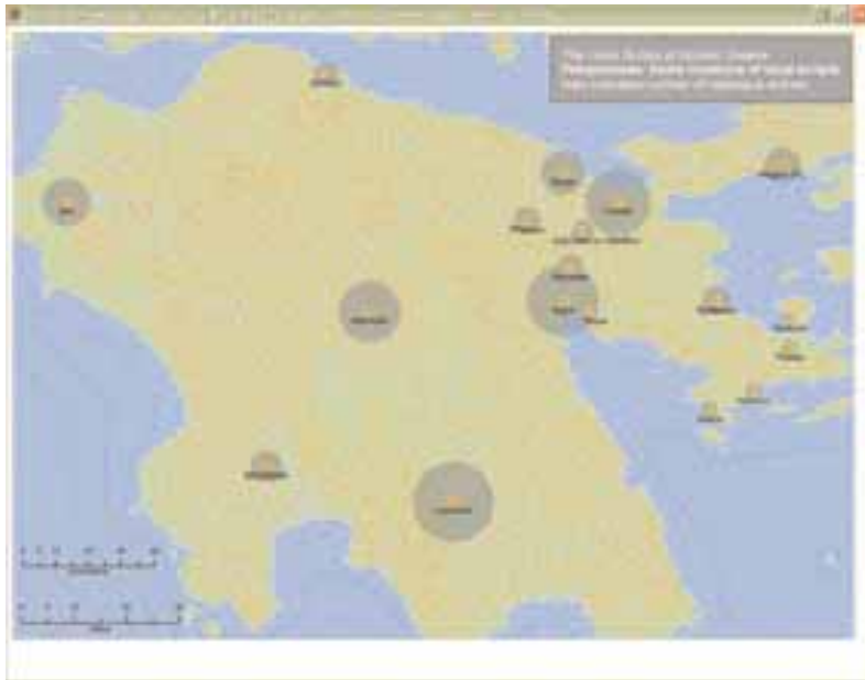
3. Ένας από τους νέους θεματικούς χάρτες (ανάλυση 1000 x 720 εικονοστοιχεία), με την κατανομή και, συγκριτικά, τον αριθμό των επιγραφών σε τοπικά αλφάβητα της Πελοποννήσου στο LSAG.