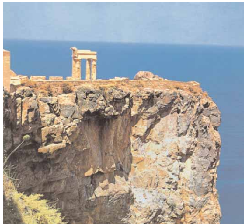
3. Τμήμα της δωρικής στοάς της Ακρόπολης της Λίνδου στη Ρόδο.

Μόνο ένα τέτοιο πρόγραμμα θα μπορέσει να αναχατίσει τις «φυσικές» καταστροφές που είναι συνηθισμένες με το εύθραυστο των αρχαιοτήτων και τις κλιματικές όσο