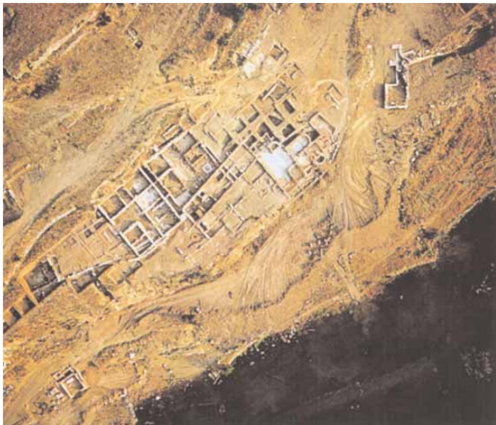
3. Καλλίπολις (Κάλλιον): Συνολική άποψη των οικοδομικών λειψάνων του αρχαίου Καλλίου, που αποκάλυψαν οι ανασκαφές του Π. Θέμελη από το 1977 ως το 1979.

σκηνής προπαρασκευαστικής για την κυρίως μύηση, είτε πρόκειται περί σκηνής των ίδιων των Μυστηρίων, η σχέση της παράστασης προς τα Μυστήρια είναι απαραίτητη και το θεϊόν ζεύγος φαίνεται κατά πάσα πιθανότητα έτοιμο για τον ιερόν γάμον, ο οποίος αποτελεί το πρωτότυπον του τέλους των Μυστηρίων. 33