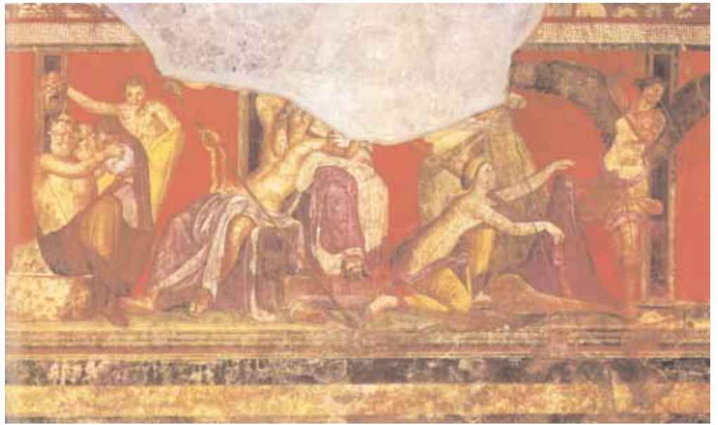
1. Τοιχογραφία του ζεύγους του Διονύσου και της Αριάδνης, στην έπαυλη Item (των Μυστηρίων) παρά την Portam Ercolanensem της Πομπηίας.

Αντίστοιχο μυθολογικό παράδειγμα υπάρχει και στις τραγωδίες Φοίνισσες και Ικέτιδες του Ευριπίδη, 14 που περιγράφουν την άφιξη στο Άργος του Τυδέα και του Πολυαίδη, εξόριστων και των δύο από την πατρίδα τους. Ο Άδραστος τους δίνει τις δύο κόρες του σε γάμο, γιατί αναγνωρίζει σ' αυτούς τον κάπρο και το λέοντα, τον ερχομό των οποίων του είχε ήδη προαναγγείλει ο χρησμός του Απόλλωνα. Ο κάπρος, λοιπόν, μυθικό αγρίμι ιδιαίτερα για τους Αιτωλούς, στην ευριπίδεια εκδοχή 15 είναι το σύμβολο του Αιτωλού Τυδέα. Αλλά και οι υπόλοιπες σχετικές φιλολογικές μαρτυρίες για τον κάπρο ως φυλετικό σύμβολο των Αιτωλών είναι άφθονες και έχουν ήδη μελετηθεί. 16 Συνάμα, αυτές οι φιλολογικές μαρτυρίες υποστηρίζονται και από αρχαιολογικά τεκμήρια: Σε νομίσματα 17 του «κοινού των Αιτωλών» (Αιτωλική Συμπολιτεία) απεικονίζεται συχνά ένας κάπρος, ή ένα στόμα κάπρου δίπλα στην αιτωλική λόγχη-ακόντιο. 18 Σιαγόνες κάπρου βρέθηκαν επίσης μεταξύ των προ-