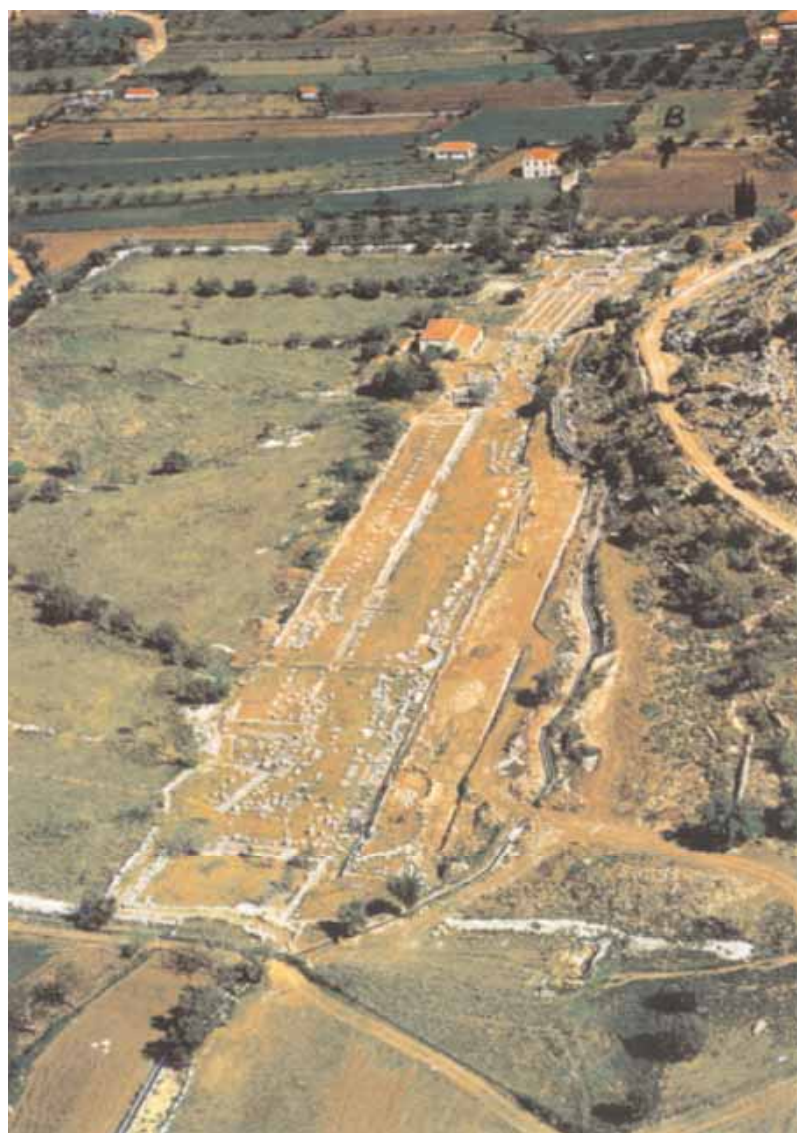
7. Πανοραμική άποψη του ιερού στον Θέρμο Αιτωλίας.

39. P. Themelis, «Das Archivhaus in Kallipolis, Aetolien», Wohnen in der klassischen Polis - Symposium, November 1978 , Berlin 1979, σποράδην· Πέτρος Θέμελης, «Ausgrabungen in Kallipolis (Ost-Aitolien), 1977/78», AAA 12/2 (1979), σ. 245-279. Πρβλ.: Πάντος, ό.π. , σ. 286-287, αρ. σφραγίσματος 238, πίν. 32· ο ίδιος, «Das Wappen von Kalydon. Ein Beitrag zur Identifizierung des Statuentypus der Artemis Laphria», Πρακτικά του XII Διεθνούς Συνεδρίου Κλασικής Αρχαιολογίας , Αθήνα, 4-10.9.1983, τόμ. 2, σ. 167-172, 168, πίν. 31.1.