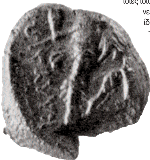
2. Άρτεμις Λαφρία: Θραύσμα πήλινου σφραγίσματος που βρέθηκε στην «οικία του Αρχείου», στην αρχαία αιτωλική πόλη Καλλιόπολη, και φέρει την επιγραφή ΚΑΛΥΔΩ[ΝΙΩΝ].