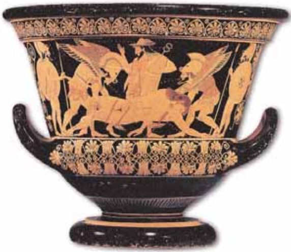
1. Ο Ύπνος και ο Θάνατος μεταφέρουν τον νεκρό Σαρπηδόνα. Αττικός καλυκωτός κρατήρας, 515-510 π.Χ. Νέα Υόρκη, Μητροπολιτικό Μουσείο Τέχνης.

Μικρά Ασία μέχρι τη Ρώμη, θεωρήθηκε ότι ιδρύθηκαν με μεταφορά της λατρείας από αυτό. Ήδη στον ύστερο 5ο αιώνα π.Χ. η λατρεία μεταφέρθηκε στη νότια πλευρά της Ακρόπολης των Αθηνών.