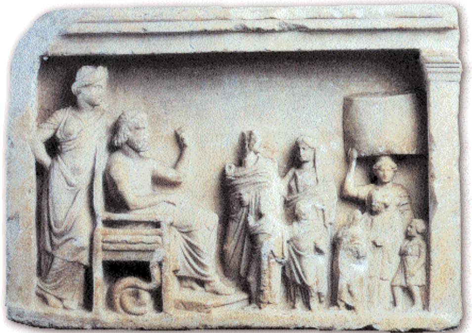
2. Αναθηματικό ανάγλυφο στο οποίο απεικονίζεται οικογένεια με προσφορές προς τον Ασκληπιό και την Υγεία, δεύτερο μισό 4ου αι. π.Χ. Βερολίνο, Antikensammlung.

Οι αρχαίοι γιατροί χρησιμοποίησαν τη δίαιτα και την άσκηση, όπως συνάγεται από τα συγγράμματά τους και από επιγραφές με «συνταγές» που δίδονταν σε συγκεκριμένους ασθενείς. Παράλληλα, η παρατήρηση της ενέργειας