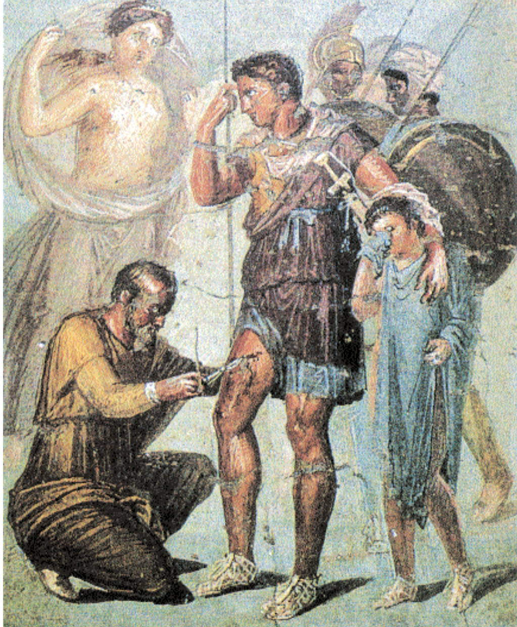
6. Ο γιατρός Ιάπυξ ενώ προσπαθεί να βγάλει αιχμή βέλους από τον δεξιό μηρό του Αινεία. Ο Βιργίλιος αναφέρει ότι το τραύμα επούλώθηκε τελικά χάρη στην τοποθέτηση στην πληγή του θεραπευτικού βοτάνου δίκταμον, που εδώ απεικονίζεται να φέρνει η μητέρα του ήρωα θεά Αφροδίτη. Τοιχογραφία από την οικία του Σιρίκου στην Πομπηία. 1ος αι. μ.Χ. Νεάπολη, Εθνικό Αρχαιολογικό Μουσείο.