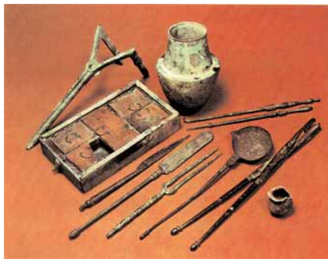
4. Διάφορα ιατρικά όργανα, όπως νυστέρι, αιμοστατική λαβίδα και καθετήρες. Ευρήματα που χρονολογούνται στην Ελληνιστική περίοδο, κατά τη διάρκεια της οποίας γνώρισε σημαντική ανάπτυξη ο κλάδος της ανατομίας. Λονδίνο, Βρετανικό Μουσείο.

Η δωρεάν προσφορά υπηρεσιών από γιατρούς σε πόλεις μαρτυρείται συχνά και είναι χαρακτηριστικά σχετικά δημόσια ψηφίσματα που τιμούν τέτοιους γιατρούς για την αυταπάρνησή τους. Η ιατρική γνώση αναπτύχθηκε βεβαίως και στις παρυφές του ελληνορωμαϊκού κόσμου,