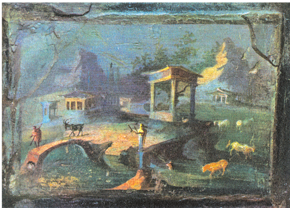
3. Ειδυλλιακό τοπίο, όπως απεικονίζεται σε τοιχογραφία από την Πομπηία. Εθνικό Μουσείο Νεαπόλεως.

Ιδρυτές της ιδέας του Φυσικού Δικαίου που στηρίζεται στη διαχρονική και αμετάβλητη λογική του ανθρώπου και της φύσης, οι στωικοί θεωρούσαν τη νομοθεσία ως ατελή απομίμηση του Φυσικού Δικαίου που διέπει όλους τους ανθρώπους, συμπεριλαμβανομένων και των σκλάβων. Στο πλαίσιο αυτό προτάθηκε η διάκριση μεταξύ του μακρόκοσμου και του μικρόκοσμου, ο οποίος εκπροσωπείται από τον άνθρωπο, αποτελώντας μικρογραφία του μακρόκοσμου. 14 Με την αναγωγή της φιλίας σε μέγιστη αρετή διαμορφώθηκε μια κοσμοπολιτική αντίληψη που ήθελε τον άνθρωπο-πολίτη του κόσμου να δέχεται την οικουμενική πολιτεία ως τη μοναδική μορφή πολιτικής κυριαρχίας. 15 Η φιλοσοφική αντίληψη της ενότητας των Στωικών προσαρμόστηκε καλύτερα από τις άλλες στη νέα ιστορική πραγματικότητα των πολυπολιτισμικών πόλεων, παρέχοντας το ιδεολογικό υπόβαθρο για την εδραίωση των θεσμών της πολυεθνικής και ενιαίας γεωγραφικά αυτοκρατορίας με συνδετικό σημείο αναφοράς τον ελληνικό πολιτισμό.