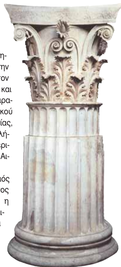
4. Κορινθιακό κιονόκρανο, περ. 3ος αι. π.Χ. Επίδαυρος, Αρχαιολογικό Μουσείο.

Βασικός προσανατολισμός του πολιτικού συστήματος ήταν η προώθηση και η διατήρηση της πολυπολιτισμικότητας με κύρια αρχή αυτήν της συνύπαρξης και σεβασμού των μη ελληνικών πολιτισμών με σημαντικότερα πεδία εφαρμογής το στράτευμα και