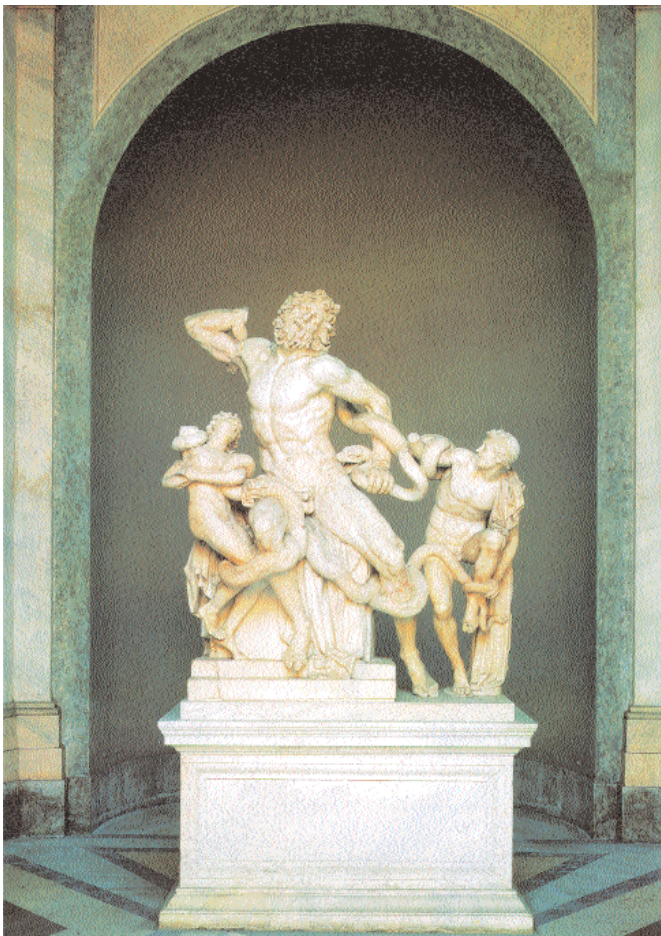
2. Ο Λαοκών και οι γιοι του. Μέσα 2ου αι. π.Χ. Ρώμη, Μουσείο Πίου Κλημεντίνου.

Ως μείζον ιστορικό γεγονός, που αποτελεί και την απαρχή της ελληνιστικής περιόδου, θα μπορούσε να θεωρηθεί η ίδρυση της αυτοκρατορίας από τον Αλέξανδρο. Ειδικότερα από το 336 π.Χ., οπότε ο Αλέξανδρος κληρονόμησε από τον πατέρα του το βασίλειο της Μακεδονίας και την ηγεσία ενός συνασπισμού ελληνικών κρατών, έως το 321 π.Χ., λίγο πριν από το θάνατό του, αυτός ήταν ο νόμιμος ηγεμόνας μιας αυτοκρατορίας που επεκτεινόταν από την Αίγυπτο ως την Ινδία με κοινή γλώσσα την ελληνιστική κοινή 6 και κύρια μορφή κοινωνικής οργάνωσης την πόλη-κράτος. Καθ' όλη την ελληνιστική περίοδο, που διήρκεσε έως το 30 π.Χ., πολλές πόλεις της παλαιάς Ελλάδας διατήρησαν την αίγλη τους, όπως η Αθήνα, η οποία παρέμεινε ένα σημαντικό φιλοσοφικό κέντρο, και οι Συρακούσες, αλλά υποσκελίσθηκαν από τις νέες ή ανακαινισμένες πόλεις της Ανατολής με σημαντικότερη την Αλεξάνδρεια, που εξελίχθηκε σε κέντρο των επιστημών. 7 Ειδικότερα, εκτός της Αλεξάνδρειας, σε κυριότερα αστικά κέντρα αναδείχθηκαν η Πέργαμος, η Αντιόχεια, η Πέλλα και δευτερευόντως η Ρόδος, η Ταρσός, η Έφεσος και οι Τράλλεις. 8