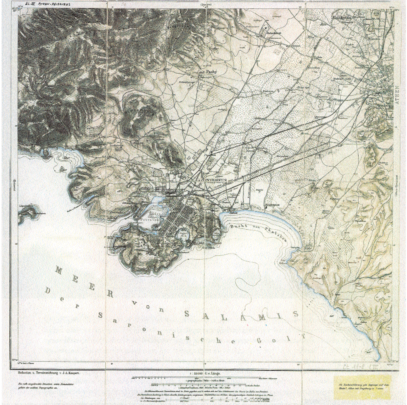
5. Η αρχαία πόλη του Πειραιά, χτισμένη κατά το ιπποδάμειο σύστημα, και τα Μακρά Τείχη. Χάρτης του J.A. Kaupert, 1881.

των ανατολικών βασιλείων συνοδεύτηκαν από τη μετατόπιση της θεματολογίας από την ανθρωποκεντρικότητα στην καθημερινή ζωή και τις πολεμικές εκστρατείες. Συγχρόνως στις εξελίξεις στην τέχνη πρωταγωνιστούσαν πλέον οι πρωτεύουσες των ισχυρών βασιλείων της Ανατολής σε αντίθεση με τις περισσότερες πόλεις της παλαιάς Ελλάδας. Οι νέες τάσεις στην τέχνη προσανατόλισαν την αρχιτεκτονική προς την κατασκευή πολυδάπανων οικοδομημάτων μεγάλης κλίμακας, με έμφαση στην πολυτέλεια και την προτίμηση στον κορινθιακό ρυθμό. Ακολούθως η πολεοδομία, ως η συνισταμένη των προαναφερόμενων παραγόντων, χαρακτηρίστηκε από την επέκταση των πόλεων και την αυτοκρατορική διάσταση των μεγάλων αστικών κέντρων, με αντιπροσωπευτικά παραδείγματα την Αλεξάνδρεια και την Έφεσο. Τέλος, στο πλαίσιο