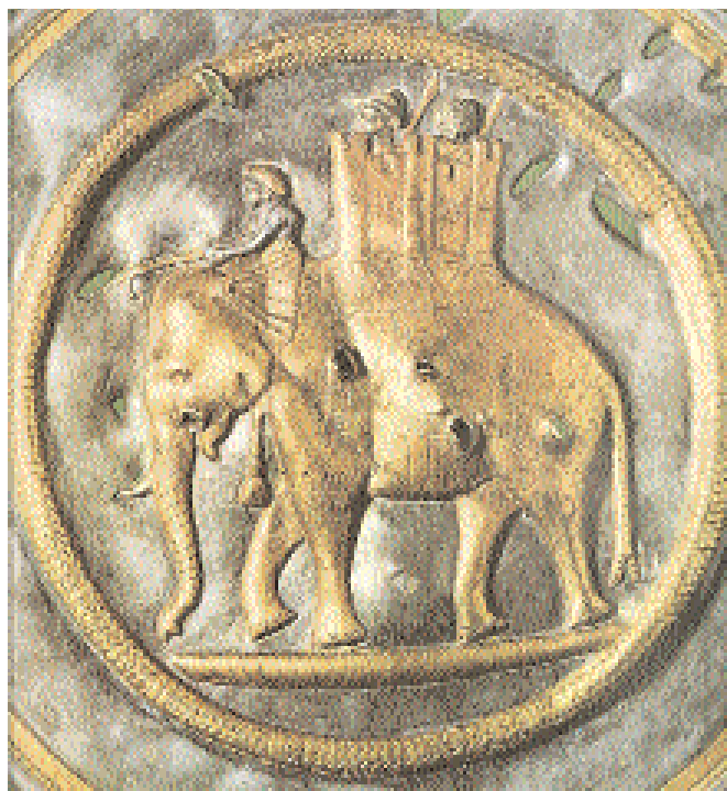
7. Φάλαρο αλόγου με παράσταση πολεμικού ελέφанта που οδηγείται από μακεδόνες στρατιώτες. Λένινγκραντ, Μουσείο Ερμιτάζ.

Ο εφοδιασμός ελεφάντων ξεκίνησε από τον Πτολεμαίο Φιλάδελο και συνεχίστηκε για σχεδόν έναν αιώνα από τους Λαγίδες. Οι ελάχιστες μαρτυρίες για το κυνήγι ελεφάντων