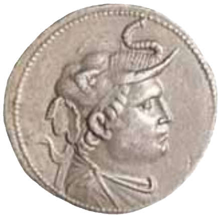
5. Αργυρό τετράδραχμο με πορτρέτο του Δημητρίου Α΄ της Βακτρίας, που φορεί περικεφαλαία από δέρμα ελέφαντα. Γύρω στο 190 π.Χ. Λονδίνο, Βρετανικό Μουσείο.

Η πτολεμαϊκή επέκταση, επομένως, κατά μήκος των ακτών της Ερυθράς θάλασσας εξυπηρετούσε ταυτόχρονα τις ανάγκες του εμπορίου και της απόκτησης ελεφάντων για το στρατό των Πτολεμαίων.