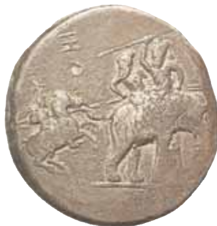
6. Αργυρό δεκάδραχμο, αναμνηστικό της νίκης του Υδάσπου. Εικονίζεται ο Αλέξανδρος με τον Βουκεφάλα, ενώ επιτίθεται εναντίον του Πώρου, που βρίσκεται πάνω στον πολεμικό ελέφαντα. Λονδίνο, Βρετανικό Μουσείο.