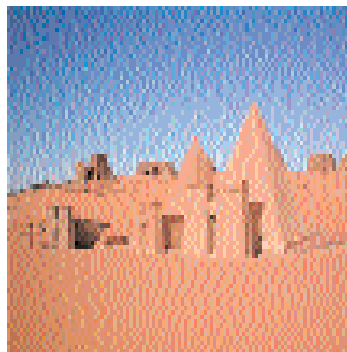
4. Άποψη της περιοχής Moussawwarat-es-soufra του Σουδάν (αρχαία Μερή) με τις ταφικές πυραμίδες.

Ο Στράβωνας, εκτός από το κυνηγετικό πεδίο με το όνομα του Λίχα, μας αναφέρει και «βωμούς» με το ίδιο όνομα, νότια του Μπαμπ-ελ-Μαντέμπ. Το όνομά του αναφέρεται και σε άλλη αναθηματική επιγραφή από την Άνω Αίγυπτο, σε αφιέρωση που θα έκανε προφανώς ο ίδιος πάλι μετά την επιστροφή του από το δεύτερό του ταξίδι. Η δεύτερη αυτή αναθηματική επιγραφή αναφέρεται στο βασιλιά και τη βασίλισσα, τον Διόνυσο και ίσως την Ἴσιδα· ενώ αναγράφεται ξανά ότι στάλθηκε «για δεύτερη φορά». 20 Στην εξιστόρηση της μάχης της Ραφίας ανάμεσα στον Πτολεμαίο Δ΄ και στον Αντίοχο Γ΄, το 217 π.Χ., ο Πολύβιος 21 περι-