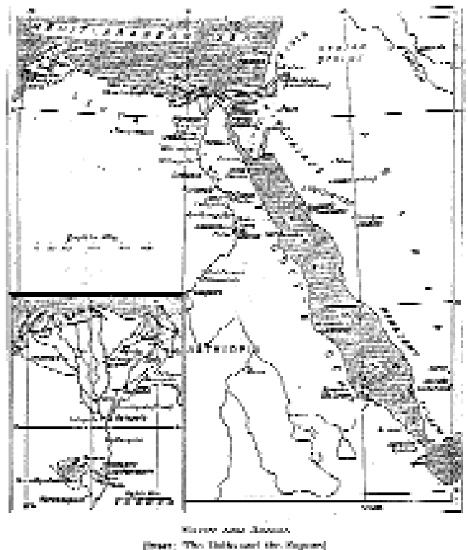
1. Αίγυπτος και Αραβία με τις παράκτιες πόλεις της Τρωγλοδυτικής ακτής.

Την εποχή των Πτολεμαίων τα νότια όρια της Αιγύπτου βρίσκονταν πολύ βορειότερα από τα αντίστοιχα νότια σύνορα των Αιγυπτίων Φαραώ. Σύνορο αποτελούσε το Ασσουάν, με την κάτω Νουβία να λειτουργεί ως ουδέτερη ζώνη ανάμεσα στην Αίγυπτο και το σουδανικό βασίλειο της Μερόης (νότια του δεύτερου καταρράκτη). Ο Στράβων αναφέρει μια αποστολή ως τη Μερόη, με επικεφαλής κάποιον Φίλωνα, στις αρχές του 3ου αιώνα π.Χ., αλλά αργότερα, ανάμεσα στο 206/205 π.Χ. και το 187/186 π.Χ., οι εξεγέρσεις των ιθαγενών απέκοψαν ολόκληρη τη νότια Αίγυπτο και τις περιοχές πέρα από την Αλεξάνδρεια από τον έλεγχο της κεντρικής διοίκησης. 5 Οι εξεγέρσεις αυτές έπαψαν με την ήττα του τελευταίου αιγυπτίου ηγεμόνα, του Χαόννοφρι, το 186 π.Χ. Για το πτολεμαϊκό εμπόριο, ωστόσο, μεγαλύτερη σημασία είχαν η επέκταση και οι εξερευνήσεις που έγιναν στη νοτιοανατολική έρημο, προς την Ερυθρά θάλασσα, αλλά και η θαλάσσια εμπορική σύνδεση με την Ινδία αργότερα. 6 Το φαινόμενο των εξερευνήσεων εμφανίστηκε από νωρίς και συνεχίστηκε όλα τα χρόνια της βασιλείας των τεσσάρων πρώτων Πτολεμαίων. Σχετιζόταν εν μέρει με την αναζήτηση εμπορικών δρόμων που θα παρέκαμπταν τους κλειστούς της νότιας Αραβίας, αλλά ακόμη περισσότερο με το κυνήγι ελεφάντων. Από τότε που ο Αλέξανδρος αντιμετώπι-