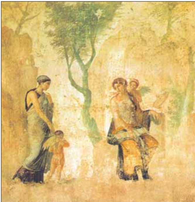
3. Η Αφροδίτη με τον μικρό Έρωτα. Τοιχογραφία των αρχών του 1ου αι. μ.Χ., που βρίσκεται στο Εθνικό Αρχαιολογικό Μουσείο της Νεάπολης στην Ιταλία.

Γι' αυτό πολέμησε στον Τρωικό Πόλεμο στο πλευρό των Τρώων. Έπρεπε να προστατέψει το γιο της, τον Αινεία, που μαχόταν ηρωικά τους Αχαιούς. Και χωρίς αμφιβολία, έπρεπε να υποστηρίξει τον εκλεκτό της, τον Πάρη, που της έδωσε το χρυσό μήλο της Έριδας, στέφοντάς την βασίλισσα της ομορφιάς.