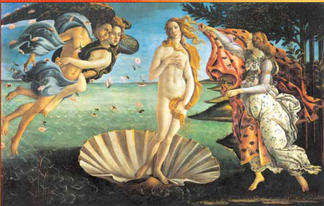
1. Η γέννηση της Αφροδίτης, όπως την αναπαράστησε σε πίνακά του ο διάσημος ζωγράφος Σάντρο Μποτιτσέλι (περ. 1485).

Τι ατυχία για την Αφροδίτη, που δεν ήταν ευτυχισμένη ούτε από το σύζυγο που της έδωσε ο Δίας. Τον Ήφαιστο παντρεύτηκε, άντρα κακομούτσουνο, κουτσό και μόνιμα λερωμένο με καπνιά, εκείνη που προτιμούσε τον παλικαρά Άρη... και βρέθηκε κάποτε στην αγκαλιά του παγιδευμένη σ' ένα χρυσό δίχτυ! Τι ντροπή για μια θεά! Η Αφροδίτη δεν το 'βαλε κάτω και μεταμορφωμένη σε θνητή παντρεύτηκε τον Αγχίση, τον αδελφό του