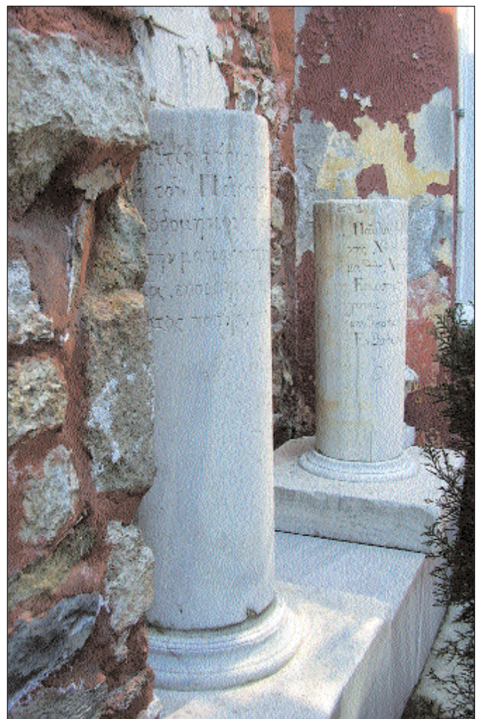
1. Οι επιτάφιας στήλες του Δημητρίου Σκυλίτση και του Παύλου Ροδοκανάκη.

Μπαίνοντας σήμερα από την βόρεια είσοδο της αυλής της Παναγίας της Καφατιανής, αριστερά της εισόδου, ευρίσκονται δύο όμοιες επιτάφιας στήλες (εικ. 1) με τα εξής επιγράμματα: