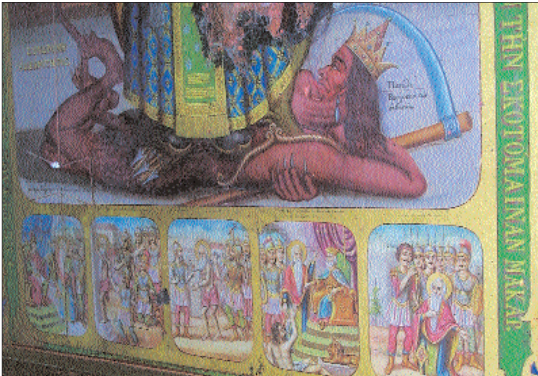
2. Η πανώλη. Λεπτομέρεια εικόνας του αγίου Χαράλαμπος με σκηνές από το βίο του.

ματίωση επί παραδείγματι. Οι μήνες της Ανοιξέως είναι οι μήνες με τον μεγαλύτερο αριθμό θανάτων εισερχομένων με σπηθικά νοσήματα στο Νοσοκομείο των Επτά Πύργων, κατά τον Α. Πασιπάτη. Επίσης, από το 1839-1843 υπάρχει μια προϊούσα αύξηση των εισερχομένων με σπηθικά νοσήματα, από 1,37% το 1839, σε 5,20% το 1842 και 6,62% το 1843. Είναι λοιπόν επίσης εύλογο να υποθέσουμε ότι οι εξεταζόμενοι θάνατοι του Δημητρίου Σκυλίτση, Εμμανουήλ Σκυλίτση και Παύλου Ροδοκανάκη προήλθαν από σπηθικό νόσημα, π.χ. φυματίωση, χωρίς να αποκλείουμε τις άλλες αιτίες. Από την ίδια αιτία πρέπει να πέθανε και η μητέρα του Παύλου Ροδοκανάκη, Φράγκα Ροδοκανάκη, στις 26 Δεκεμβρίου 1851, σαν συνέπεια του δριμύτατου ψύχους του προηγούμενου χειμώνα (ποσοστό εισερχομένων 5,50%). 16