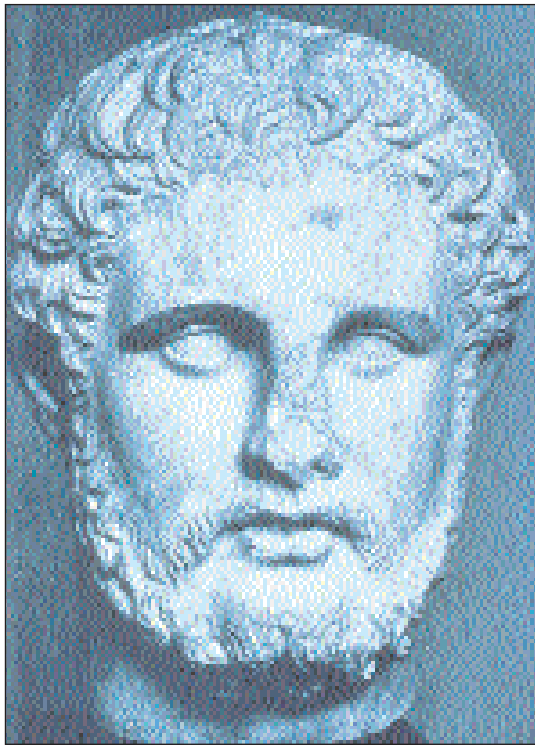
3. Προτομή του Αλκιβιάδη, ρωμαϊκό αντίγραφο έργου του 4ου π.Χ. αιώνα.

Η απόφασή του ωστόσο να προδώσει την Αθήνα έχει, πέρα από τη λογική, και μια ψυχολογική εξήγηση: Για τον Αλκιβιάδη, η πατρίδα δεν είναι η υπέρτατη εκείνη αξία, στην οποία ο πολίτης υποκλίνεται με σεβασμό. Είναι μια έννοια οικεία, όπως η μητέρα, από την οποία περιμένει αποδοχή και επιβράβευση, όταν της αφοσιώνεται ψυχή τε και σώματι. Η πικρία που αισθάνεται είναι φυσικό επακόλουθο της απόρριψης που εισπράττει. Ο Αλκιβιάδης αντιδρά σπασμωδικά, όπως