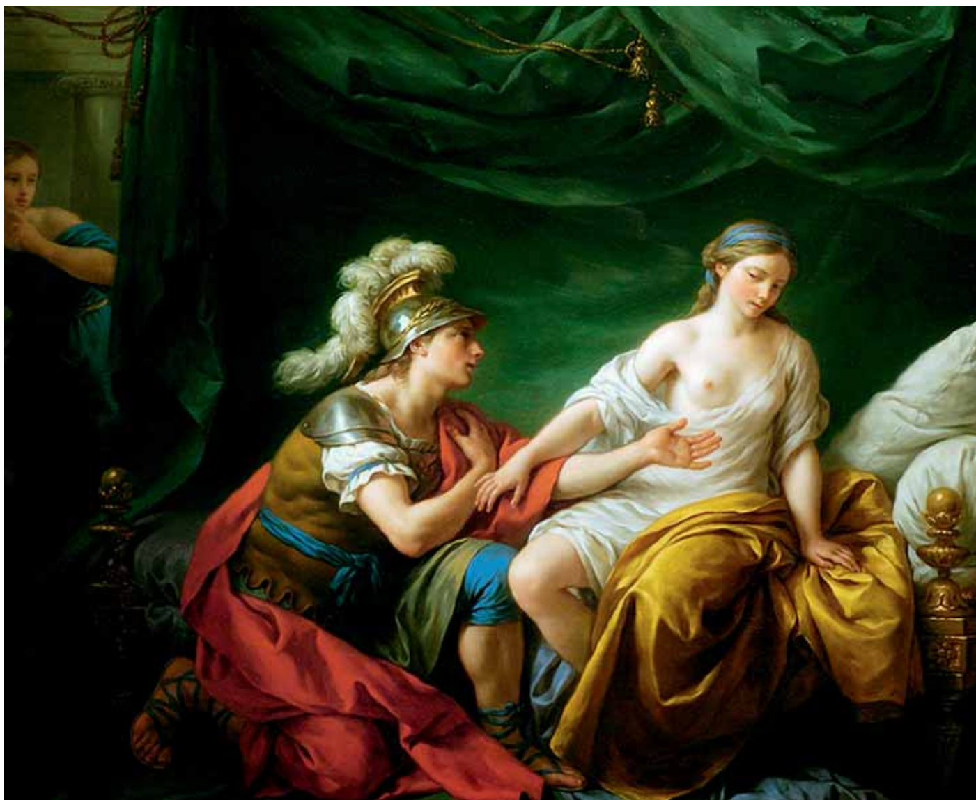
5. Ο Αλκιβιάδης γοναπιστός μπροστά στην ερωμένη του. Πίνακας του Louis-Jean-François Lagrenée. Μουσείο Τέχνης Norton Simon Pasadena (ΗΠΑ).

ναναστροφή του με τον Σωκράτη και συνακόλουθα τον καλύτερο εαυτό του. Τα απαρνιέται όχι χωρίς οδύνη και ενδοιασμούς: το απόσπασμα από το πλατωνικό Συμπόσιον (216a-c) περιγράφει με πολύ παραστατικό τρόπο το δίλημμα και την εσωτερική του πάλη: «Με εξαναγκάζει πράγματι να παραδεχτώ ότι ενώ προσωπικά έχω πολλές ακόμη ελλείψεις, δεν φροντίζω για τον εαυτό μου, αλλά ασχολούμαι με των Αθηναίων τις υποθέσεις. Βίαια λοιπόν, σαν να ήταν οι Σειρήνες, κλείνω τ' αυτιά μου και απομακρύνομαι: διαφορετικά, όλη μου τη ζωή θα δαπανούσα καθισμένος στο πλευρό του, ώσπου να γεράσω. Ενώπιον αυτού μόνου από τους ανθρώπους έχω δοκιμάσει το αίσθημα που δεν θα πίστευε κανείς πως υπάρχει μέσα μου: το να ντρέπομαι οποιονδήποτε. Κι όμως, αυτόν και μόνον ντρέπομαι. Γιατί γνωρίζω καλά ότι δεν έχω τη δύναμη να διαφωνήσω ότι δεν είναι καθήκον μου να πράξω ό,τι αυτός μου συνιστά. Κι