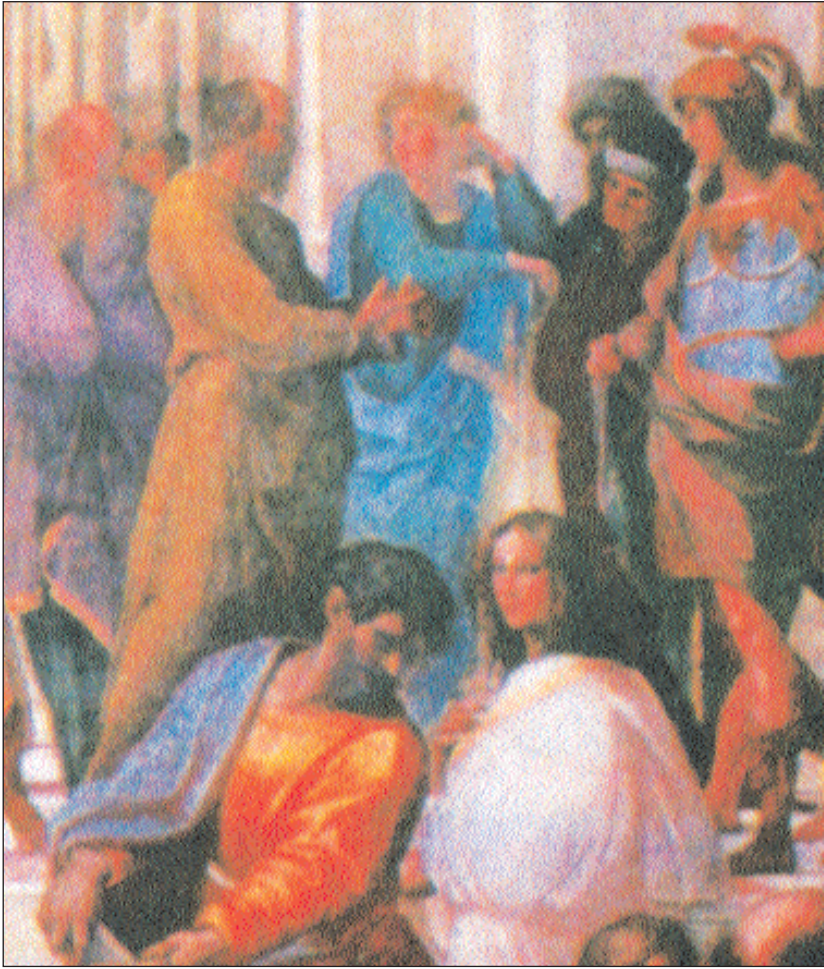
1. Σωκράτης και Αλκιβιάδης. Τμήμα του πίνακα «Η Σχολή των Αθηνών», του Ραφαήλ. Βατικανό, 1509-1510.

μέσω αλόγιστης σπατάλης χρημάτων, ροπή προς ακρότητες και σκάνδαλα προκειμένου οι συμπολίτες του να ασχολούνται μαζί του, εριστικότητα και έκλυτος ερωτικός βίος. 7