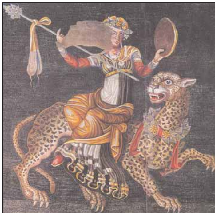
3. Ο θεός Διόνυσος επάνω σε πάνθηρα.

τική του μορφή. Όσο κι αν επέμενε ο Δίας ότι καλός ήταν έτσι όπως τον έβλεπε, η ξεροκέφαλη κοπέλα ήθελε να τον δει αλλιώς. Κεραυνοί και αστραπές έπεσαν πάνω της και η Σεμέλη χάθηκε για πάντα. Την τελευταία στιγμή, ο πολυμήχανος Ερμής άρπαξε το αγέννητο αδελφάκι του και το έραψε στο μηρό του Δία για να μεγαλώσει ακόμα τρεις μήνες και να γεννηθεί στην ώρα του.