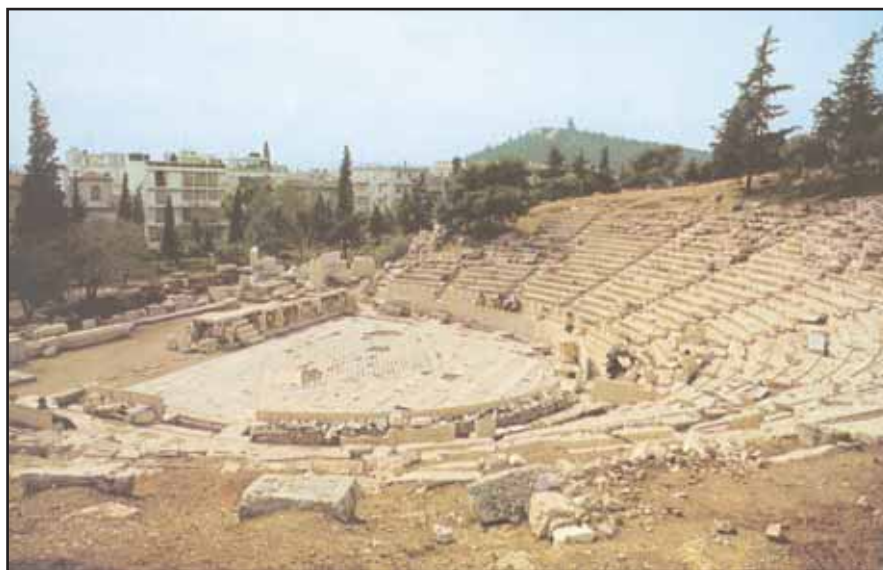
4. Για να τιμήσουν το θεό Διόνυσο οι Αθηναίοι έχτισαν κάτω από την Ακρόπολη ένα θέατρο, όπου γίνονταν θεατρικοί αγώνες στην αρχαιότητα. Σήμερα το θέατρο αυτό είναι ένας όμορφος αρχαιολογικός χώρος, που μπορεί να επισκεφτεί κανείς ενώ κάνει τον περίπατό του στην οδό Διονυσίου Αρεοπαγίτου.

Όταν ο Δίας αγάπησε τη Σεμέλη, τη βασιλοπούλα της Θήβας, μεταμφιέστηκε σε θνητό για να την πλησιάσει. Η Σεμέλη έμεινε έγκυος και μεγάλωνε στα σπλάχνα της ένα αγοράκι. Ποιος όμως και ποια μπορούσε να αντισταθεί στην Ήρα που, μεγάλη θεά καθώς ήταν, έβλεπε κι ήξερε τα πάντα; Η Ήρα ξεγέλασε τη Σεμέλη και της είπε να ζητήσει από τον πατέρα του παιδιού της να φανερωθεί μπροστά της με την πραγμα-