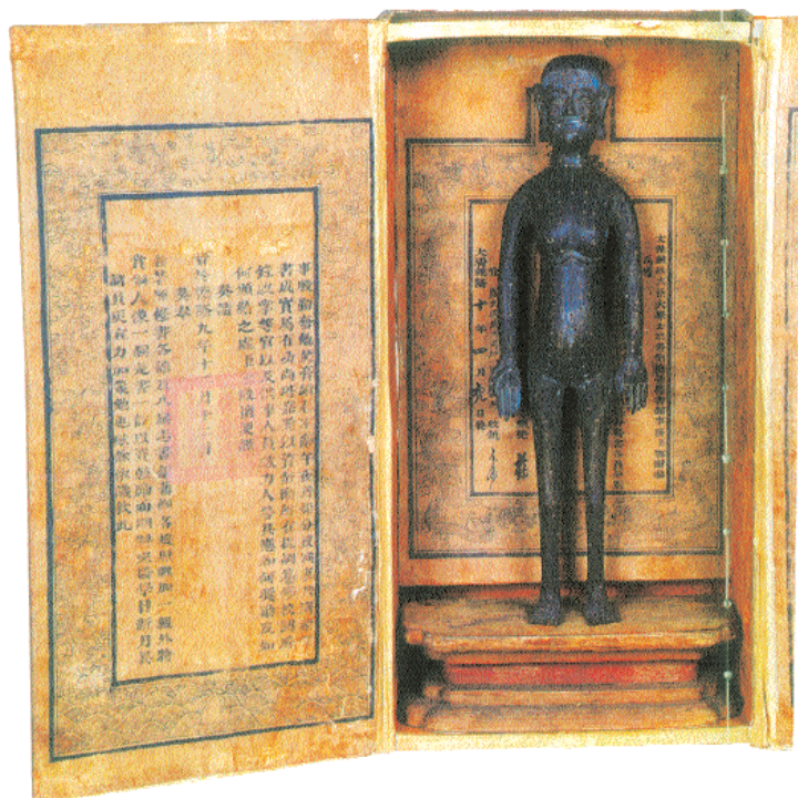
5. Αγαλαματίδιο, στην επιφάνεια του οποίου διακρίνονται 365 σημεία βελονισμού. Κατασκευασμένα είτε από χαλκό είτε από ξύλο αυτού του είδους τα αγαλαματίδια χρησιμοποιούνται για την εκπαίδευση των νέων θεραπευτών «στην τέχνη του βελονισμού», ώστε να μάθουν να εντοπίζουν με ακρίβεια τα σημεία βελονισμού, να γνωρίζουν το όνομά τους και τη θεραπευτική τους ιδιότητα.

Στρατού να πάνε σε ένα σχολείο κωφάλαλων στην πόλη Λιαογιουάν της επαρχίας Κιρίν για να προσφέρουν τις υπηρεσίες τους. Η ομάδα αποτελείται από τρεις «ιατρούς» και πέντε «νοσηλεύτες-βοηθούς», με επικεφαλής τον Που-Γιου. Αν και κανείς δεν είχε ιατρική εκπαίδευση, ούτε προηγούμενη εμπειρία από θεραπεία κωφάλαλων και φυσικά δεν υπήρχαν στοιχεία για το αν και με ποιο τρόπο ο βελονισμός βοηθά τους κωφάλαλους (!!!), άρχισαν να πειραματίζονται, αρχικά βάζοντας βελόνες στον εαυτό τους και αργότερα στα παιδιά του σχολείου. Στόχος τους, η θεραπεία της συγκεκριμένης πάθησης. Έμειναν στο σχολείο 17 χρόνια κάνοντας βελονισμό στα παιδιά μέρα παρά μέρα, ενώ ο ιατρός έστελνε συνεχείς αναφορές στον Πρόεδρο Μάο. Με επιστολή του στον Μάο Τσε Τουνγκ ανακοινώνουν ότι από τα 168 παιδιά, τα 157 άρχισαν να ακούν και τα 149 να ομιλούν. Θεώρησαν την επιτυχία των ιατρών επιτυχία της πολιτικής του Μάο, του οποίου το όνομα αναφέρεται πάνω από 60 φορές στις 35 σελίδες του μικρού αυτού βιβλίου που εκδόθηκε στο Πεκίνο το 1972 με την υποστήριξη της κυβέρνησης.