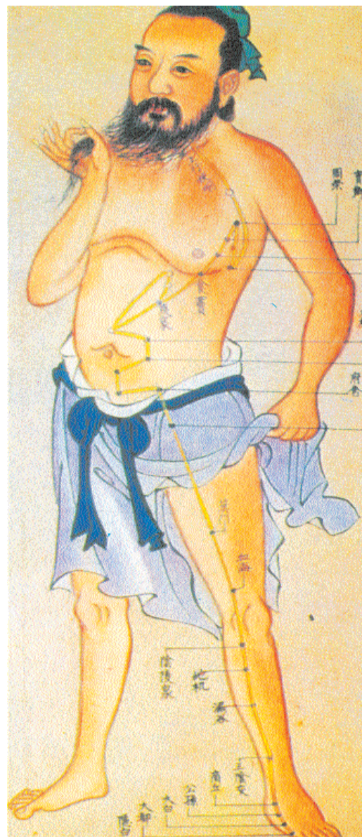
1. Ζωγραφική απεικόνιση Κινέζου στο σώμα του οποίου σημειώνονται τα 42 βασικά σημεία βελονισμού.

Λογικά, η ανακάλυψη τρόπων και μεθόδων για την αντιμετώπιση της αρρώστιας, προηγείται ιστορικά από την ανακάλυψη της γραφής. Έτσι, μέχρι να καταγραφεί το πρώτο κείμενο που αναφέρεται στην ιατρική και ειδικότερα στη βελονοθεραπεία, ο μύθος ήταν αυτός που μετέφερε τη γνώση. Όπως όλοι οι λαοί, έτσι και οι Κινέζοι, διαθέτουν πλούσιους μύθους. Ένας τέτοιος μύθος, του 5ου αιώνα μ.Χ., περιγράφει τον τρόπο με τον οποίο ένας φημισμένος ιατρός της αρχαίας Κίνας, ο Ζεν Γκουάν, θεράπευσε τον ώμο του αυτοκράτορα της επαρχίας Λου Τζου. Ο Ζεν Γκουάν προσκλήθηκε στα ανάκτορα επειδή τον τελευταίο καιρό ο αυτοκράτορας αντιμετώπιζε έντονο άλγος στον ώμο με συνέπεια να μην μπορεί να ασκεί τα διοικητικά και στρατιωτικά του καθήκοντα. Ο ιατρός –που έπρεπε οπωσδήποτε να διασώσει τη φήμη του– ύστερα από προσεκτική εξέταση, παρήγγειλε στον αυτοκράτορα να σημαδέψει με το τόξο του το κέντρο