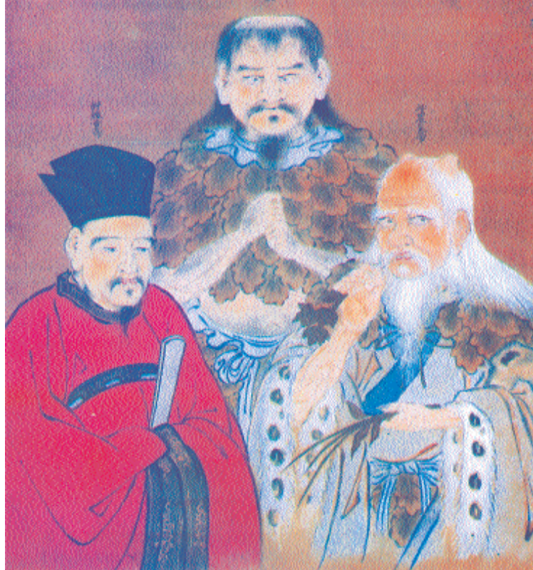
4. Οι λεγόμενοι αυτοκράτορες της κινεζικής ιατρικής. Αριστερά ο Χουανγκ Τι, στον οποίο αποδίδεται η συγγραφή του αρχαίου Βιβλίου Ιατρικής Νέι Κινγκ, στο κέντρο ο Φου Χσι, που ανακάλυψε τα βασικά στοιχεία του κόσμου, και δεξιά ο Σεν Νουγκ, που θεωρείται ο εισηγητής των ιατρικών ιδιοτήτων των φυτών.

Οι πρώτες βελόνες που χρησιμοποιήθηκαν ήταν φτιαγμένες από πέτρα που ονομαζόταν «πιέν», λέξη η οποία σύμφωνα με ένα λεξικό ιδεογραμμαμάτων (Τσου Βεν Τσιέ Τσε) της περιόδου της δυναστείας των Χαν (206-220 π.Χ.) σημαίνει «θεραπεύω μια αρρώστια τσιμπώντας με μια πέτρα». Αργότερα κατασκευάστηκαν βελόνες από μπαμπού ή από κόκαλο, επεξεργασμένες ώστε να είναι λείες, οξύαιχμες και λεπτές. Με την ανακάλυψη της μεταλλουργίας, αντικαταστάθηκαν από χάλκινες, χρυσές ή ασημένιες. Η μέθοδος αυτή κατευνάζει μια σειρά από πόνους, όπως πονόδοντο, πόνο στα αυτιά, την πλάτη, το στομάχι, την κοιλιά, τις αρθρώσεις. Με το συνθετικό πνεύμα τους, για ακόμα καλύτερα αποτελέσματα, ένωσαν το βελονισμό με την καυτηρίαση, δηλαδή τρυπούσαν τα σημεία βελονισμού και πάνω στη βελόνα έκαιγαν το φυτό Αρτεμισία . Αυτή η τεχνική καλείται μόξα και χρησιμοποιείται μέχρι σήμερα στην Κίνα και αλλού. Βέβαια, πολύ γρήγορα κατάλαβαν ότι τα πρώτα 13 σημεία βελονισμού ήταν ανεπαρκή. Η συστηματική εξερεύνηση της επιφάνειας