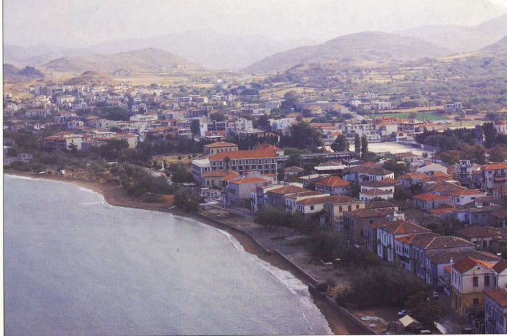
1. Άποψη της Μύρινας (Ρωμέϊκος Γιαλός), από το Κάστρο.