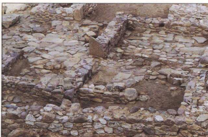
9. Ιερό Αρτέμιδος στη Μύρινα (οικόπεδο Τραταρού).

Από το κεντρικό τμήμα του λόφου της Λέσχης Αξιωματικών, γνωστό και ως κτήμα Παντελίδη, προέρχονται τα θαυμάσια, ιδιότυπα ειδώλια των μουσικών γυναικείων μορφών (εικ. 9), αφιερώματα στη θεότητα, που πρόσφατες μελέτες την ταύτισαν με την Αρτεμη 9 . Αλλά η ανασκαφική έρευνα της Εφορείας αρχαιοτήτων απεκάλυψε στην ιδιοκτησία Τραταρού το εκτός της πόλεως ιερό τέμενος της Αρτέμιδος (εικ. 2, 9). Η ταυτότητα της θεότητας τεκμηριώνεται από επιγραφικές μαρτυρίες στο χώρο της ανα-