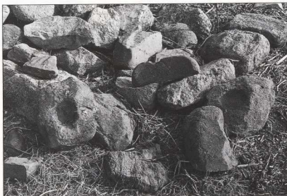
6. Προγόμελος: Λίθινα προϊστορικά εργαλεία που χρησιμοποιήθηκαν ως οικοδομικό υλικό.