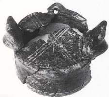
5. Πώμα της Χαλκολιθικής περιόδου από την ανασκαφή στη Λέσχη Αξιωματικών στη Μύρινα.

ευρήματα από τον αποθέτη του Καβειρίου 6 , το ποικίλο και πλούσιο υλικό από το ιερό της Μεγάλης Θεάς, που αργότερα ταυτίστηκε με τη Λήμνο, τα κτερίσματα από τη νεκρόπολη της Ηφαιστίας, τα ευρήματα του ιερού της Αρτέμιδος 7 , από την ιδιοκτησία Τραταρού, και τα μοναδικά ειδώλια του αποθέτη από το κτήμα Παντελίδη (εικ. 8) στη Μύρινα μαρτυρούν έντονη δραστηριότητα σε ολόκληρο το νησί από τον 8ο ως τον 5ο π.Χ. αιώνα.