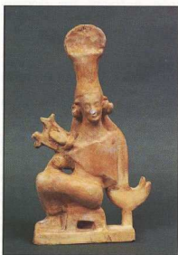
8. Ειδώλιο γυναικας-κιθαρωδού, από τη Μύρινα.

σκαφής, από γραμματειακές αναφορές και από το είδος των ευρημάτων, μεταξύ των οποίων θυσιασμένος νεαρός ταύρος, στον πύρνα του ιερού (εικ. 10), που αποτελείται από ένα αψιδωτό κτήριο με ευρύχωρη λιθόστρωτη αυλή. Γύρω ανοίγονται δωμάτια, που χρησίμευαν ως βοηθητικοί χώροι παραμονής και σίτισης των επισκεπτών. Ο υπαίθριος ιερός χώρος σχετίζεται πιθανότατα με τη λατρεία της Άρτεμης Σελήνης, που, ως γνωστόν, ταυτίστηκε αργότερα με την Ύψιπύλη 10 . Η πρόσβαση στο ιερό γινόταν από δύο εισόδους, που οδηγούσαν σε ευρυχωρίες