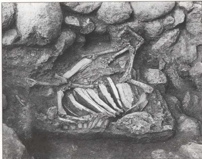
10. Ουσιασμένους ταύρους στο ιερό της Αρτέμιδος, στη Μύρινα.