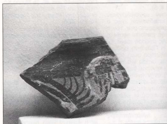
7. Μικηναϊκά όστρακα από το Κουκονήσι.