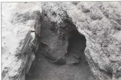
4. Προϊστορικά αγγεία, όπως βρέθηκαν στην ανασκαφή της Λέσχης Αξιωματικών στη Μύρινα.