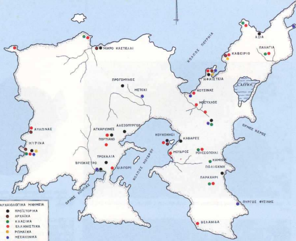
3. Χάρτης της Λήμνου, με τις αρχαιολογικές της θέσεις.