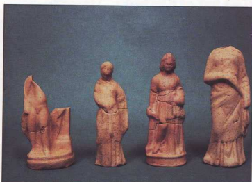
12, 13. Ελληνιστικά ειδώλια από το Κάστρο της Μύρινας.

σός του 2ου π.Χ. ως τις αρχές του 2ου μ.Χ. αιώνων. Οι τάφοι ήταν πλούσιοι σε κτερίσματα 20 : χρυσές δανάκες, νομίσματα, χρυσά κοσμήματα, αγγεία. Σημαντικό είναι το μεγαρόσχημο κτήριο, που σχετίζεται με τη λατρεία των νεκρών και τις θεότητες του κάτω κόσμου 21 . Από την προκαταρκτική μελέτη και σύγκριση με ανάλογες περιπτώσεις ναών ή βωμών σε νεκροταφεία ταυτίζεται με ναό της Αφροδίτης, στην ιδιότητά της ως θεάς του κάτω κόσμου.