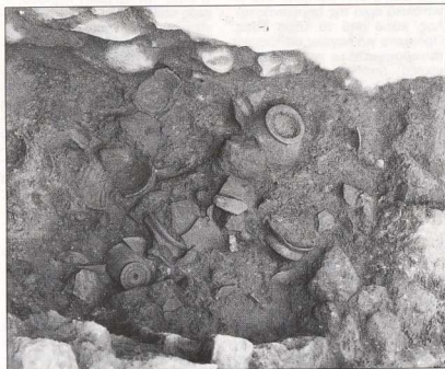
11. Εργαστήρια ελληνιστικής κεραμικής (ο αποθέτης) στη Μύρινα.

πιβεβαιώνουν τους δεσμούς με την πόλη της Παλλάδος και την ισχύ των Εξ Αθηνών Μυρινάδων, που επέβαλαν τα χαρακτηριστικά σύμβολα των Αθηνών στα νομίσματα της νέας τους πατρίδας. Η περιορισμένη ανασκαφική έρευνα, που άρχισε πριν από wenige χρόνια, δεν έφερε στο φως παρά ελάχιστα λείψανα των κλα-