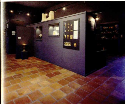
Αποψη της βόρειας πτέρυγας του Μουσείου των Αρχανών.