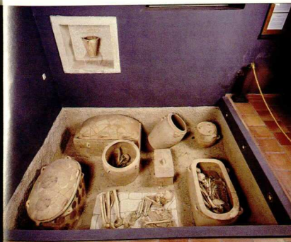
Μουσείο Αρχανών. Σαρκοφάγοι, ταφικοί πιθόι και νεκροί από το νεκροταφείο στο Φουρνί.

ρόπητά του, ακριβώς όπως και οι Αρχάνες, το σημαντικό κεφαλοχώρι της βόρειας Κρήτης, ο χώρος στον οποίο παρακολουθείται ο κύκλος της ζωής και του θανάτου σ' όλη την αρχαιότητα, ακόμη και στους μεταμινωικούς χρόνους. Η παραχώρηση του ακινήτου για πενήντα χρόνια από το Δήμο Αρχανών στην αρχαιολογική υπηρεσία και η γενναία βοή-