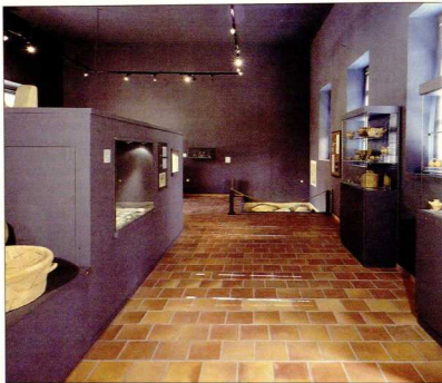
Άποψη της νότιας πτέρυγας του Μουσείου των Αρχανών.

Στον διπλανό Πίνακα X εικονίζονται πολλά ακόμη δείγματα ελεφαντουργίας από την ανασκαφή των Αρχανών. Την κορυφή της κεντρικής κατασκευής στέφουν εδώ πωρολιθικά κέρατα καθιέρωσης (Έκθεμα 19). Η έκθεση των μινωικών αρχαίων κλείνει με ένα τριποδικό βωμό από γραπτό κοπίαμα, από την Τουρκογειτονιά (Έκθεμα 20), κι έναν ψηλό λίθινο λύχνο (Έκθεμα 21) με φτίλι και