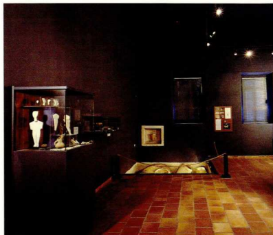
Άποψη της ανατολικής πτέρυγας του Μουσείου των Αρχανών.

λάδι, που εικονογραφεί άλλη μια πτυχή του καθημερινού βίου.