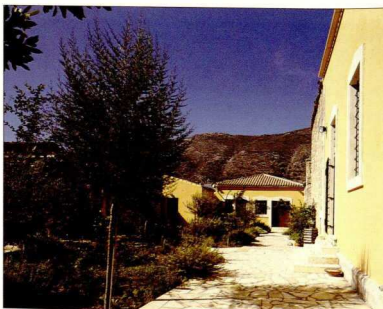
Η αυλή πίσω από το Μουσείο των Αρχανών.

Οι προθήκες και τα ελεύθερα εκθέματα αριθμούνται με αραβι-