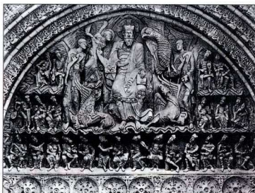
4. Η Δεύτερη Παρουσία ο Χριστός είναι πλαισιωμένος από τα τέσσερα συμβλήματα των Ευαγγελιστών και τους είκοσι τέσσερις πρεσβυτέρους (Δ 4-7). Ανάγλυφο του 12ου αι., τύμπανο της εκκλησίας του Αββαείου του Μουασάκ.