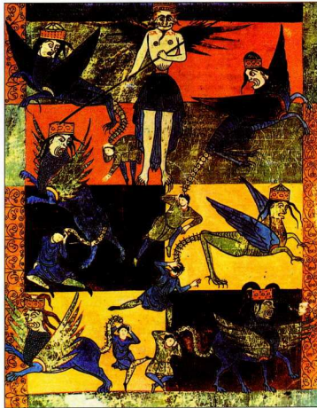
2. Οι τέσσερις Ιππότες της Αποκάλυψης (Στ 1-8). Μικρογραφία 10ου-11ου αι., Εθν. Βιβλ. Μαδρίτης, fol. 135.

Πλούσια εικονογράφηση, εμπνευσμένη από την Αποκάλυψη , κοσμεί Καρολιγγιανό χειρόγραφο «ρυθμού των νήσων» (insu-