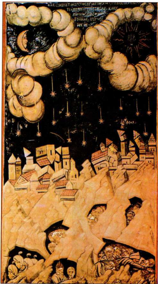
13. «Ο κλονισμός του Σώματος» (Στ 12-17). Τοιχογραφία 16ου αι., Άγιον Όρος, Μονή Διονυσίου.