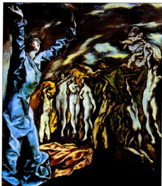
8. «Το όραμα της Αποκάλυψης του Αγίου Ιωάννη», Δομητικός Θεοτοκόπουλος, λάδι σε μουσαμά 2,25x1,39 μ., 1610-1614, Νέα Υόρκη, Μητροπολιτικό Μουσείο.