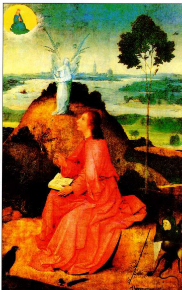
7. «Ο Άγιος Ιωάννης στην Πάτμο». Ξεφάνης Μποδ, λάδι σε έβλο, 63x43,2 εκ., γύρω στο 1480, Βερολίνο, Gemäldegalerie.