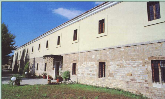
Αποψη της πρόσοψης του Μουσείου Λαμίας που στεγάζεται στον στρατώνά των χρόνων του Όθωνα.

Τ ο Αρχαιολογικό Μουσείο Λαμίας στεγάζεται στον αναστηλωμένο στρατώνά των χρόνων του Όθωνα, που βρίσκεται στην ακρόπολη της αρχαίας Λαμίας, στον κηρυγμένο αρχαιολογικό χώρο του κάστρου της Λαμίας.