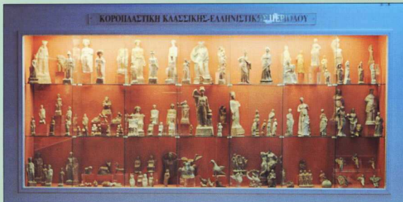
5. Άποψη προθήκης: "Κορφοπλαστική Κλασικής-Ελληνιστικής περιόδου".

Προθήκη XI: Πάνω σε σχηματοποιημένα ομοιώματα ανδρός και γυναικός έχουν εκτεθεί αντικείμενα που χαρακτηρίζουν το κάθε φύλο,