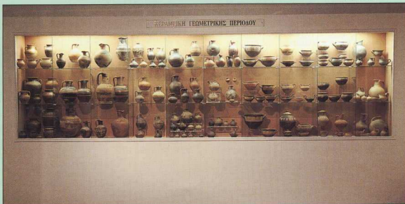
4. Άποψη προθήκης: "Κεραμική Γεωμετρικής περιόδου".