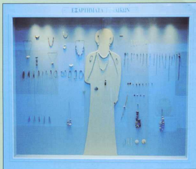
2. Άποψη προθήκης: "Εξαρτήματα γυναικών Μικηναϊκής περιόδου".

Προθήκη VIII: Εκτίθεται η τροχίλατη κεραμική της μεταβατικής περιόδου, από το τέλος της Εποχής του Χαλκού (Μικηναϊκής) και