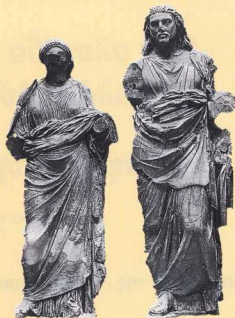
Τα αγάλματα του Μουσούλου και της γυναίκας του Αρτεμισίας, που σήμερα βρίσκονται στο Βρετανικό Μουσείο του Λονδίνου.

Όπως οι Φαραώ στην Αίγυπτο, έτσι κι ο Μαύσωλος ήθελε να τον τιμούν και να τον θυμούνται οι άνθρωποι στους αιώνες. Το άγαλμά του,