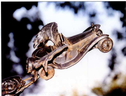
Ήπιονο αυτοκίνητο της Νίκης, έργο εμπνευσμένο από όνειρο, Iliirian Shima.

Η φαντασιώδης χωροταξία ονείρων και δη εκτεταμένων ονείρων και παγανιστικών οπτασιών αποτελούν το πλαίσιο μιας αιγιματικής αναγενησιακής ερωτικής μυθιστορίας, της επονομαζο-