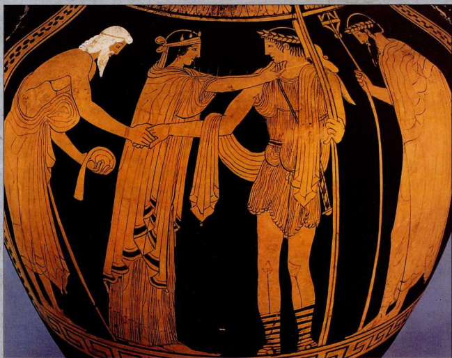
1. Οι γονείς του Θησέα Αιγέας και Αίθρα, μαζί με το θεό Ποσειδώνα, αποχαιρετούν τον Θησέα.

Ανδρόγεω, του γιου του Μίνωα. Ο Ανδρόγεωσ νίκησε στους αθλητικούς αγώνες που είχε οργανώσει ο Αιγέας κι εκείνος, από ζήλια, τον έστειλε να σκοτώσει τον ταύρο του Μαραθώνα που ρήμαζε τη χώρα του. Ο Ανδρόγεωσ δεν τα κατάφερε. Ο Μίνωας εξαγριώθηκε