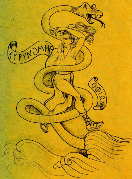
Ο Οφίων κουλουριάζεται γύρω από την Ευρυνόμη.

Η Ευρυνόμη δεν βρήκε τίποτα στέρεο για να πατήσει κι έτσι διαχώρισε αμέσως τον ουρανό από τη θάλασσα κι άρχισε να χορεύει μονάχη πάνω στα κύματα. Περιπλανιόταν, χόρευε, περιστρεφόταν όλο και πιο γρήγορα, φύσηξε αέρας, τον έπιασε στα χέρια της και τότε ξεπήδησε ένα πλάσμα τρομερό, ο Οφίων, το μεγάλο φίδι που κουλουριάστηκε γύρω από την Ευρυνόμη.