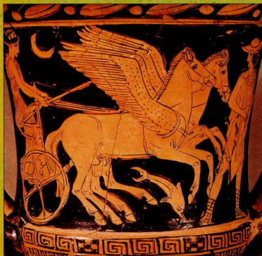
Η Σελήνη, κόρη της Φοίβης και του Άτλαντα, πάνω στο άρμα της που το οδηγεί ο Ερμής.

Η Διώνη και ο Κρείος τον κόκκινο πλανήτη Άρη. Η Μήτις, η μητέρα της Αθηνάς, και ο Κοίος ήταν υπεύθυνοι για τον μικρό Ερμή. Η Θέμις, η προσωποποίηση της Δικαιοσύνης, και ο Ευρυμέδοντας φρόντιζαν τον μεγάλο πλανήτη Δία. Η Τηθύς και ο Ωκεανός, ο πατέρας όλων των νερών, την κοντινή Αφροδίτη. Η Ρέα και ο Κρόνος τον πλανήτη Κρόνο και τα δαχτυλίδια του.