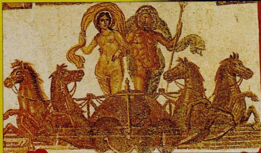
3. Ο Ποσειδῶνας με μία από τις γυναίκες του. Το ψηφιδωτό αυτό είναι της ρωμαϊκής εποχής, βρέθηκε στην Τυνησία (Utica) και εκτίθεται στο Μουσείο Bardo.

Ο θυμός του θεού ήταν τρομερός κι έκανε το βασιλιά Οδυσσέα να περιπλανιέται για δέκα χρόνια μόνος κι έρημος μέχρι να φτάσει στην πατρίδα του την Ιθάκη, μετά τον πόλεμο στην Τροία!