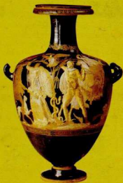
5. Στο αγγείο αυτό (αμφορία) του 4ου αιώνα π.Χ., που βρίσκεται στο Μουσείο του Ερμιτάζ στην Αγία Πετρούπολη, εικονίζεται η διαμάχη του Ποσειδῶνα (που κρατά ένα άλογο από το χαλινάρι) και της Αθηνάς (που στέκεται δίπλα σε ένα δέντρο ελιάς) για το ποιος από τους δύο θα γίνει προστάτης της πόλης των Αθηνών.

Μη νομίζεις πάντως ότι ο Ποσειδῶνας έμεινε παραπονεμένος. Αν κάνεις ένα θαλασσινό ταξίδι στη Μεσόγειο θάλασσα, σίγουρα θα συναντήσεις τα ερείπια κάποιας Ποσειδωνιάς, μιας από τις πολλές μικρές παραθαλάσσιες πόλεις που πήραν το όνομά τους από τον Ποσειδῶνα (εικ. 4).