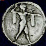
4. Νόμισμα της Ποσειδωνιάς (Paestum) του 6ου αιώνα π.Χ. Η Ποσειδωνία ήταν ελληνική αποικία που βρισκόταν στη Μεγάλη Ελλάδα (Κάτω Ιταλία). Η στάση του Ποσειδῶνα μοιάζει πολύ με εκείνη του αγάλματος στην εικόνα 1.

Όταν ήρθε η ώρα να αποφασίσουν οι κάτοικοι της Κεκροπιάς, στην Αττική, ο Ποσειδῶνας τούς χάρισε ένα άλογο, σαν εκείνα που έσερναν το χρυσό άρμα του