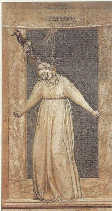
3. Απεικόνιση του αμαρτήματος της Desperatio ως μορφής που αυτοκτονεί με αγχόνη. Τζέττο ντι Μπονόνε (13ος - 14ος αι.), παρεκκλήση της Αγία, Πάντοβα.