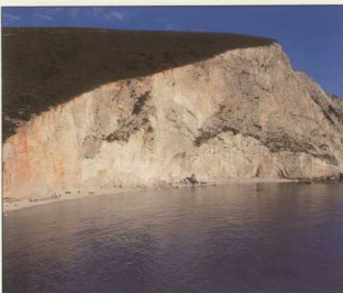
2. Βράχοι της Λευκάδας.

και ιδιαίτερα η υπεραισθησία στην αξιολόγηση τρίτων –αυτό που οι αρχαίοι αποκαλούσαν «αιδώς»– μπορούν να ερμηνευθούν στην περίπτωση του Αίαντα ως ναρκισσιστικής προέλευσης. Κατά τον Γιάννη Νηματούδη, η αυτοκτονία του ήρωα οφείλεται σε ναρκισσιστικό τραύμα.